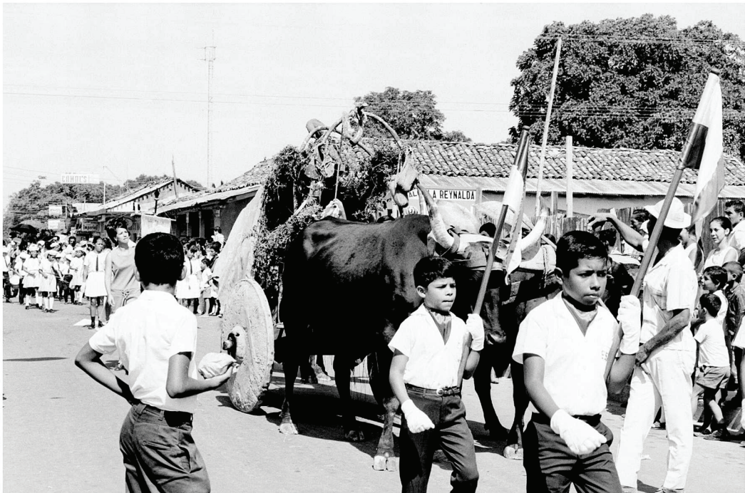
Figura 2: Gira del Ministerio de Obras Públicas y Transportes (MOPT) a Guanacaste en 1971. Desfile de la celebración de la anexión en las calles de Nicoya.

En cuanto a las actividades especiales en la provincia, sobresale la exposición ganadera que se posicionó en Liberia. La primera edición fue en 1955 y en lo posterior fue acaparando paulatinamente la atención de la celebración liberiana. Las mismas actividades que se realizaban en los desfiles y actos cívicos, así como en algunas de las actividades especiales mencionadas, se reproducían en las exposiciones. Incluso en otras partes de la provincia como Nicoya, la ganadería se hacía presente en el paisaje festivo con la incorporación de animales en los desfiles, como se aprecia en la Figura 2 . Tal fue el grado de relevancia que adquirieron las exposiciones, que las mayores autoridades políticas nacionales empezaron a concurrirlas; como los Presidentes de la República y Ministros de Agricultura. Ello constituía