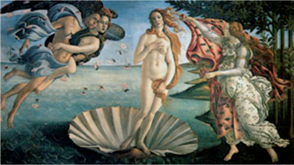
Figura 5. El nacimiento de Venus , Sandro Botticelli, 1484, Temple sobre lienzo, 278.48 cm × 172.48 cm, Galería Uffizi, Florencia.

Diótima con el mito El deseo dejar caer las alas en pos de la pasión y posesión erótica. Es decir, el pasaje de una Venus Celeste a la humana, una mujer que no se plantea ya como una diosa. He ahí círculo encantado de la mirada.