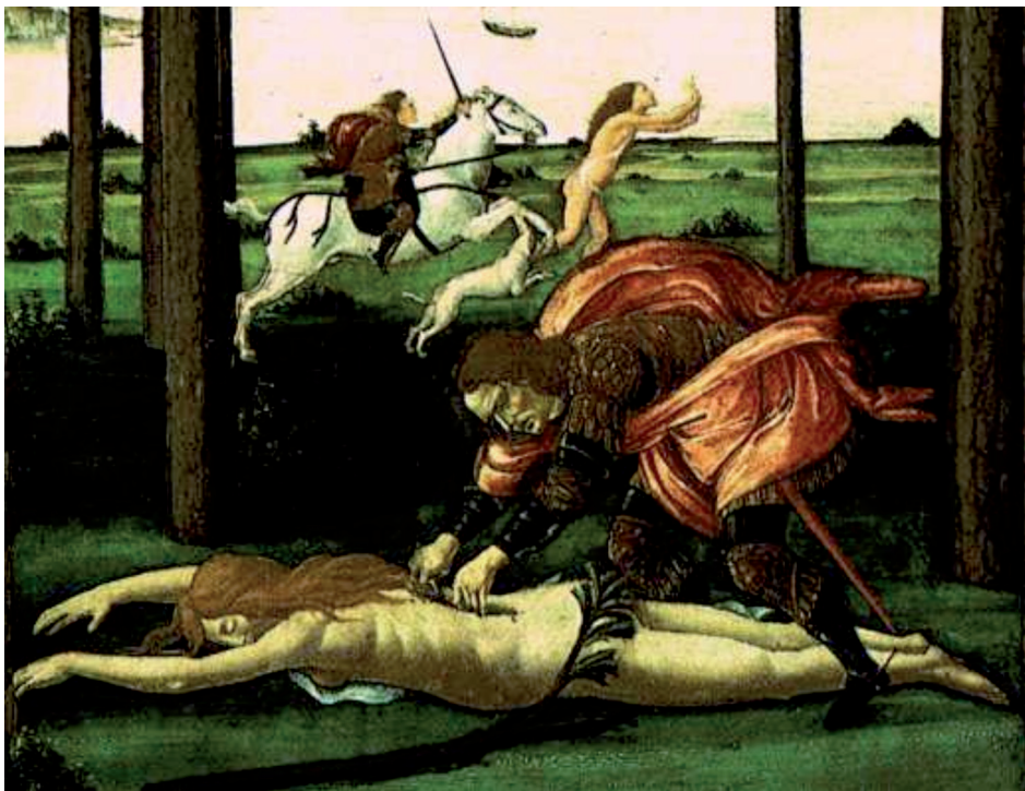
Figura 6. Historia de Nastagio degli Onesti , Sandro Botticelli, 1482, óleo sobre madera, 84 cm × 142 cm, Museo del Prado.

Esta herencia teológica de la caída o la pérdida de la gracia está estrechamente ligada a la concepción del rechazo de la carne y la desnudez del cuerpo. La desnudez adánica implica un paso entre una desnudez sin vergüenza a una que debe cubrirse. Hay un regresar hacia ese momento en que la desnudez era natural y la inocencia se perdió. Esa repetición o vuelta al cuerpo del origen, nos la presenta la última figura, donde el castigo del amante consiste en abrir, una y otra vez, a la amada. Rajar a la Venus.