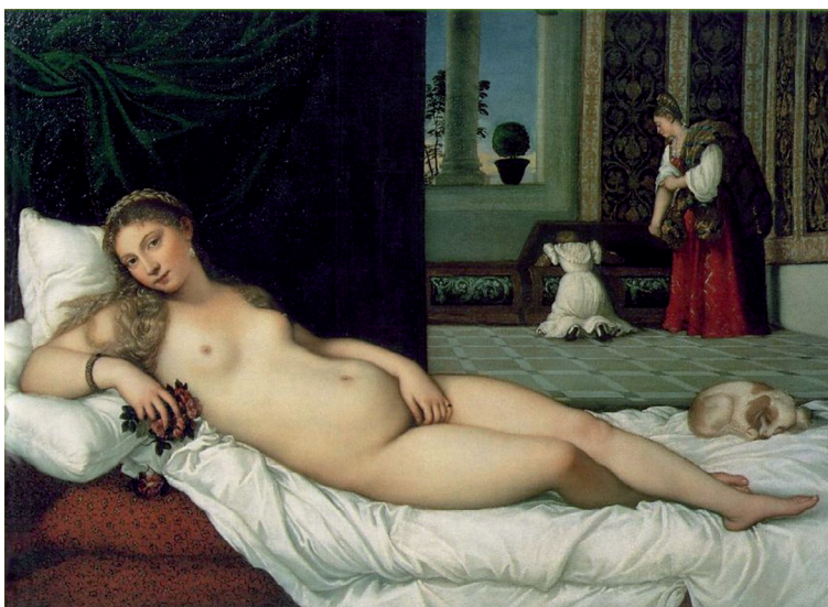
Figura 2. Venus de Urbino , Tiziano, 1538 óleo sobre lienzo, 165 x 119, Galería de los Uffizi, Florencia.