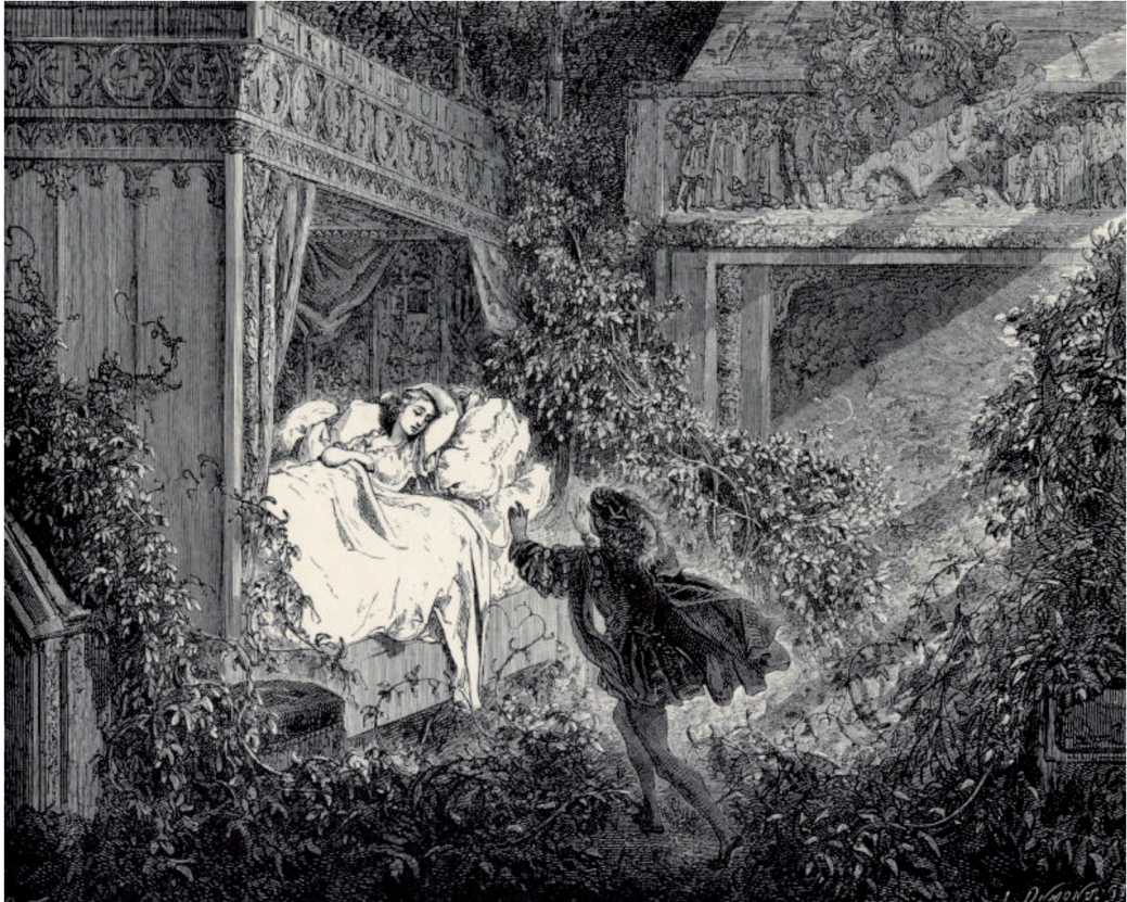
Figura 1. La Bella Durmiente. Gustave Doré's , 1867, Les Contes de Perrault , Charles Perrault.

Las imágenes de la bella durmiente y de la Venus rajada que presentamos permiten otra vía estética para la aprehensión metonímica del objeto a de Lacan, en el arte, tal como podemos observar en el grabado de Doré, de 1867.