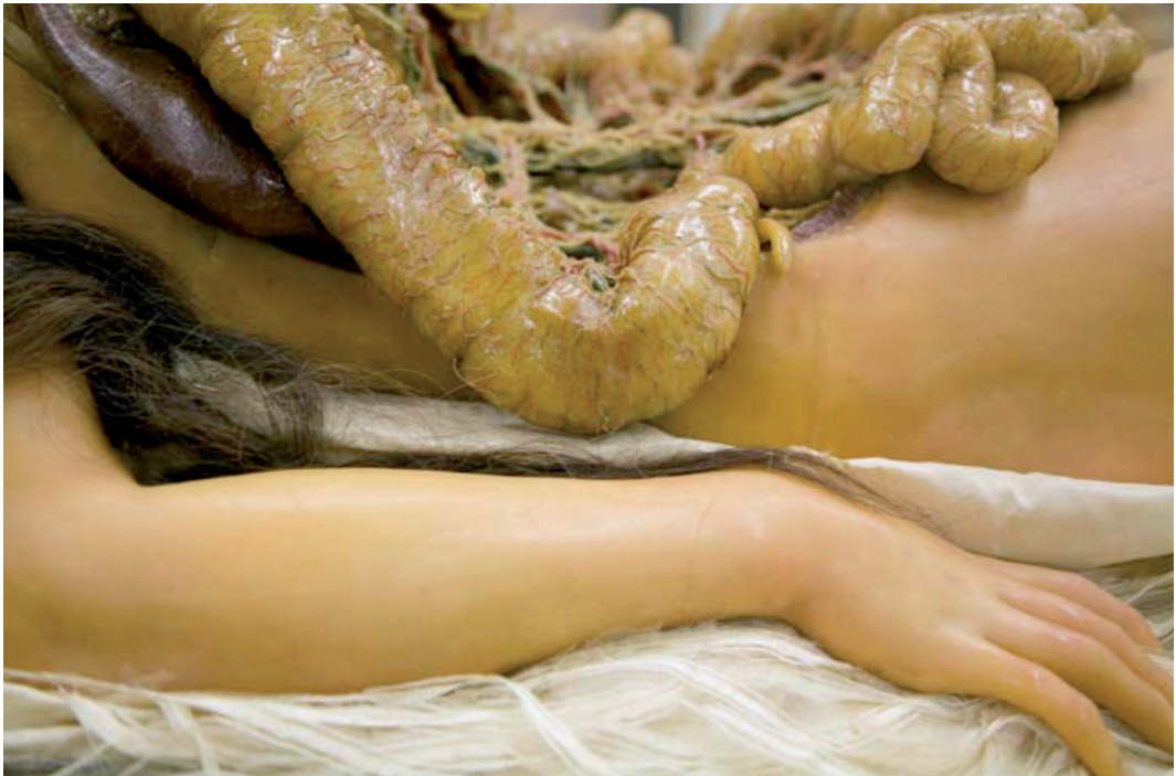
Figura 4. Venus rajada , Didi Huberman, Ouvrir Vénus.

J. Allouch (2011), “Nos recuerda el apasionante Ouvrir Vénus de Didi – Huberman aún cuando en El Banquete no se diga que Alcibíades haya abierto a Sócrates (el gesto es sugerido por Lacan cuando aloja esos agalmata en el vientre de Sócrates”) (pág. 170). Sin embargo, es D Halperin quien va más allá de esta comodidad Socrática y de este teatro a través de la imagen del espejo, porque es en el ojo del otro donde reside el poder de la vista. Un ojo que contempla y se dirige a esa nada en la pupila, donde se mira él mismo. Esta es precisamente, la imagen estática y loca de nosotros mismos y el desafío de toda alteridad. El amante deviene únicamente un otro {soi} y un alter ego.