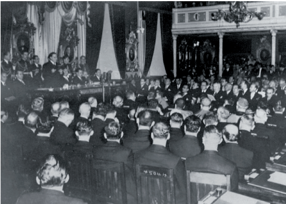
Figura 1. Acto de juramentación de Rafael Ángel Calderón Guardia. 8 de mayo de 1940.

por la Segunda Guerra Mundial. Así, en primera instancia, la crisis económica por la que atravesaba Costa Rica era una limitante para el desarrollo de una ceremonia majestuosa o pomposa; el propio Calderón Guardia expresa que sería totalmente inadecuado gastar dinero en la ceremonia dada la crisis económica que pasaba el país (“Sería injusto”, 1940). Sin embargo, se hizo todo lo posible para que la ceremonia fuera un evento vistoso y llamativo, reflejo de la dignidad de la ocasión. Para ello, se adoptaron medidas para facilitar la mayor asistencia de personas a los actos de celebración a llevarse a cabo en la ciudad capital, entre ellos destaca el dar asueto a los empleados públicos y la disposición de un servicio especial de ferrocarril entre Puntarenas y San José, exclusivamente para “partidarios y amigos” de Rafael Ángel Calderón (“Para la toma de posesión”, 1940).