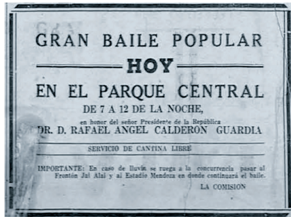
Figura 3. Anuncio del baile popular en celebración de la toma de poder de Rafael A. Calderón. 8 de mayo, 1940.

Sin embargo, la crisis económica que se vivía sí llevó a las autoridades políticas a realizar recortes en los gastos relacionados con la celebración de la toma de poder. El principal ajuste que se ven obligados a adoptar es la no realización de un