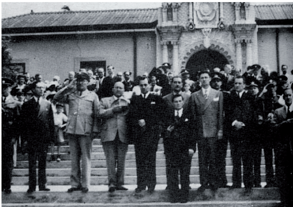
Figura 2. Recepción oficial llevada a cabo en la Casa Amarilla. 8 de mayo, 1940.

En ninguna oportunidad se ha visto una recepción como la de ayer en la Casa Amarilla. Miles de ciudadanos, desde el encopetado capitalista y hombre de la ciudad, hasta el humilde patillo, acudieron confundidos en un mismo anhelo patriótico, a testimoniar al doctor Calderón Guardia su simpatía y profundo afecto. Fue una demostración palpable de que el nuevo mandatario llega al poder rodeado del sincero cariño de la inmensa mayoría de los costarricenses. (“En medio de gran júbilo”, 1940).