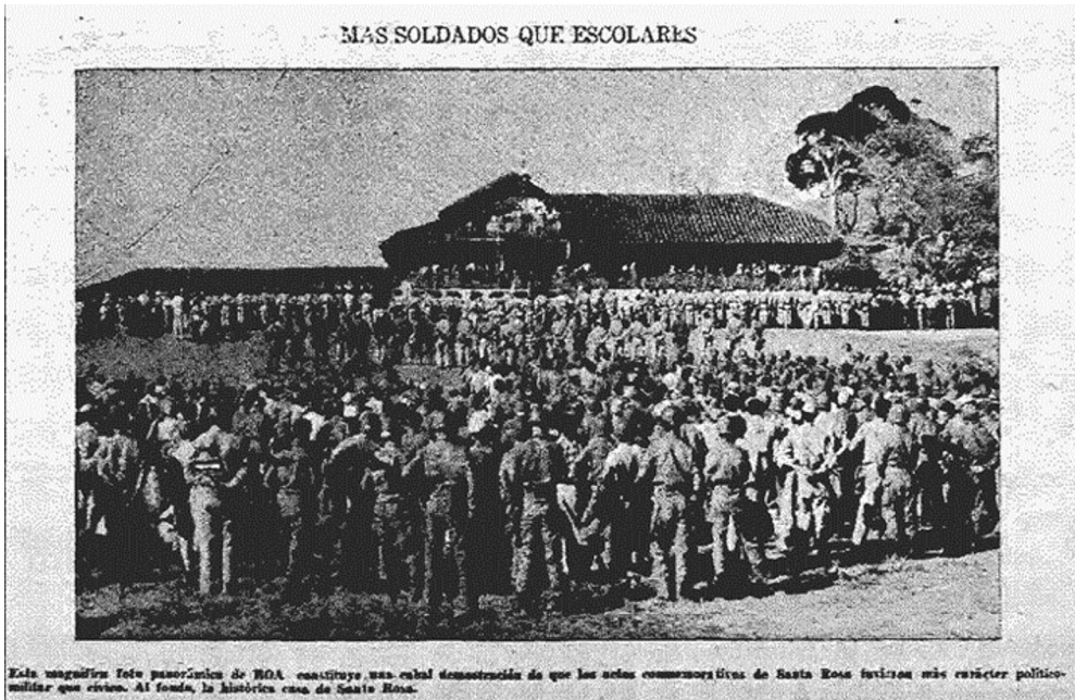
Figura 1. Más soldados que escolares [fotografía]. De Diario de Costa Rica , (p. 1), 22 de marzo de 1956.

ejército en una ceremonia en la que él mismo había definido este nuevo símbolo de la colectividad costarricense (la ausencia de ejército), destruyendo con un mazo uno de los muros del cuartel militar más importante e imponente del país, el Bellavista.