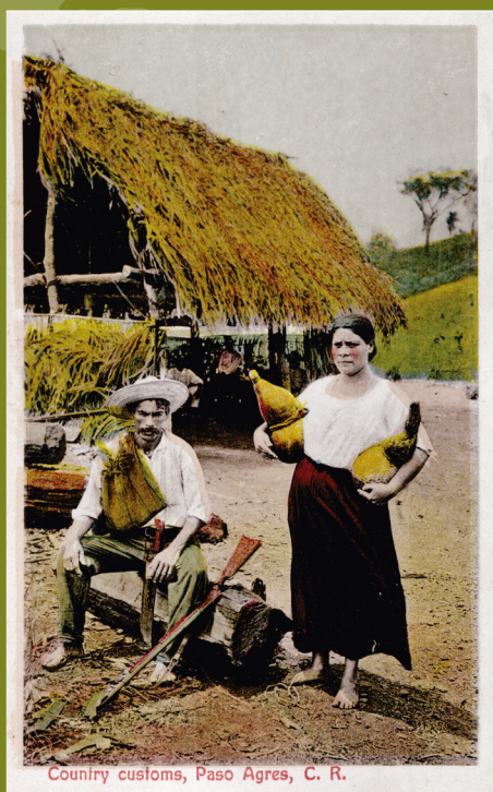
Country customs, Paso Agres, C. R.

Escuela de Historia. Universidad de Costa Rica