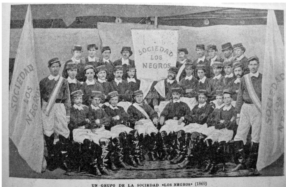
Figura 1: Los Negros en 1869 (Caras y Caretas, no. 229, 21/2/1903, p.37.)

y en la política. Tenían un salón propio en el que organizaban bailes y tertulias y actuaban también en teatros y en casas de familias distinguidas. Además, sostuvieron un semanario propio, del mismo nombre de la comparsa. Durante los carnavales ejecutaban música y cantaban canciones de su propia autoría y otras tomadas de zarzuelas. Las fuentes mencionan que, como parte de su orquesta, había pifanos, guitarras, violines, redoblantes, tambores y otros instrumentos de percusión y que realizaban movimientos que pretendían imitar los de los negros, de los que solo se cuenta con la descripción de “mover las caderas” al son de la música y “caminar sobre los talones” (esto último considerado por un observador una excentricidad sin relación con nada que hiciesen los negros reales). La vestimenta que usaban no evocaba lo africano: era de estilo militar europeo. Pero a ello sumaban caretas negras; al menos uno de ellos se tiznó la cara en 1870, pero no parece haber sido lo habitual. Al menos una de sus canciones era en “bozal”, el estilo de habla que pretendía imitar el castellano dificultoso de los esclavizados nacidos en África, y se sabe que algunos de ellos lo utilizaban en otras ocasiones. En 1867 prometieron desfilar en Montevideo (no está claro si lo hicieron); aparentemente, fue la primera comparsa de falsos negros de la que se tenían noticias allí, donde la costumbre sería pronto replicada (Adamovsky, 2021a).