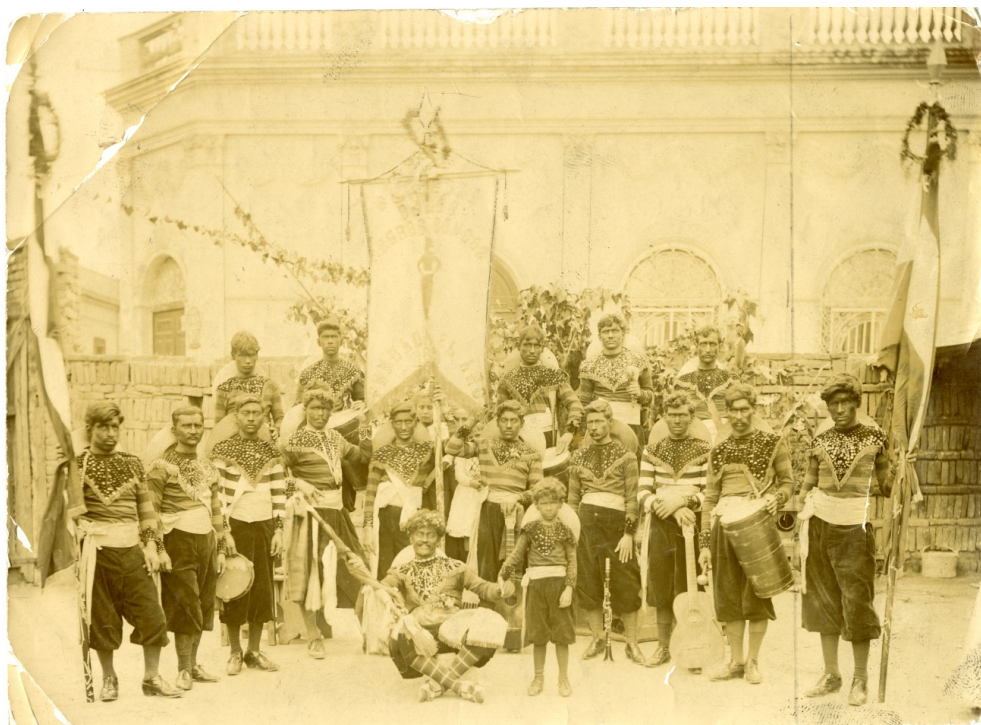
Figura 2: Sociedad de los Negros Congos, carnaval de 1891

La fotografía más temprana disponible –la única del siglo XIX– es la siguiente de los Negros Congos, tomada en 1891. Permite, por contraste con la de Los Negros, apreciar las múltiples diferencias. Llevan cara tiznada, el sombrero de paja colgado hacia atrás, pantalón y calzado oscuros, remera a rayas con una pechera y puños de fantasía con lentejuelas. Al frente, un escobero con escoba y collares; posiblemente el cuarto de la fila superior porte un atado de gramilla en la mano (no se distingue del todo), lo que podría indicar la presencia de la figura del gramillero, también procedente del candombe tradicional. Entre los instrumentos se distinguen una pandereta, un clarinete, dos guitarras y tres tamboriles: