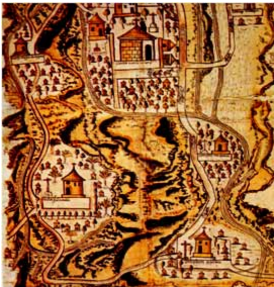
Mapa 1. Mapa de Tetela

La pintura de Tetela es una de las más ricas en contenido que puede tener el Corpus de las Relaciones Geográficas . Su riqueza radica en las diferentes perspectivas que posee, en la diversidad de sus colores, en la representación de un paisaje enriquecido por la multitud de hechos humanos que captura. Es ejemplo de una tendencia europea manifestada por la perspectiva que presenta a través del sombreado y por el tipo de las construcciones que se dibujan. Amén de la aplicación en la viveza de los colores que permite diferenciar los tipos de relieve que tiene la región.