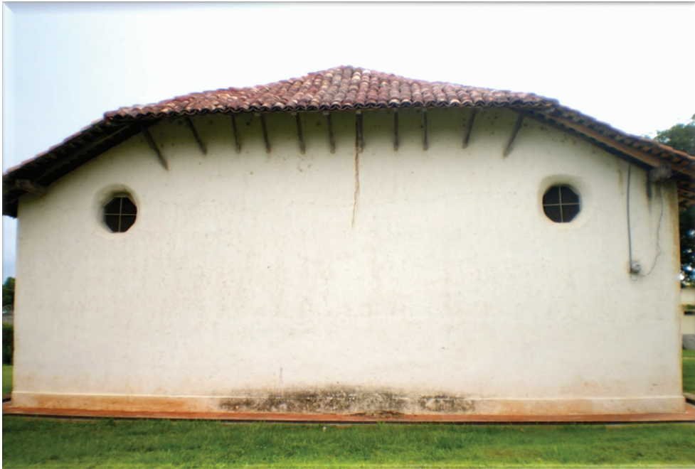
Figura 7: Fotografía fachada posterior.

En su fachada posterior, presenta dos ventanas en forma circular a una altura mayor a los cuatro metros y medio, y se logra apreciar en ella la cumbrera, el limatón y la teja de su techo.