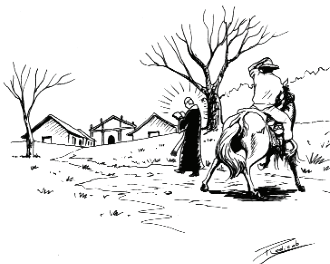
Figura 11: Seres mágicos que pueblan Guanacaste. Inédito. S.f.