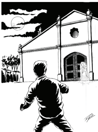
Figura 10: Seres mágicos que pueblan Guanacaste. Inédito. S.f.