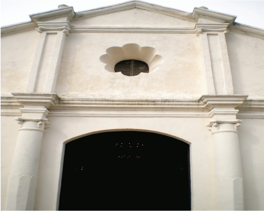
Figura 2: Fachada Ermita Nuestra Señora de la Agonía.

construcción de edificaciones religiosas, es conveniente referirse a algunos detalles puntuales relacionados con la construcción de la Ermita de la Agonía. Con antelación se ha dicho que la construcción de la Ermita en la segunda parte del siglo XIX, obedece a la creciente necesidad de contar con un nuevo templo que complementara los servicios del “deteriorado” templo parroquial.