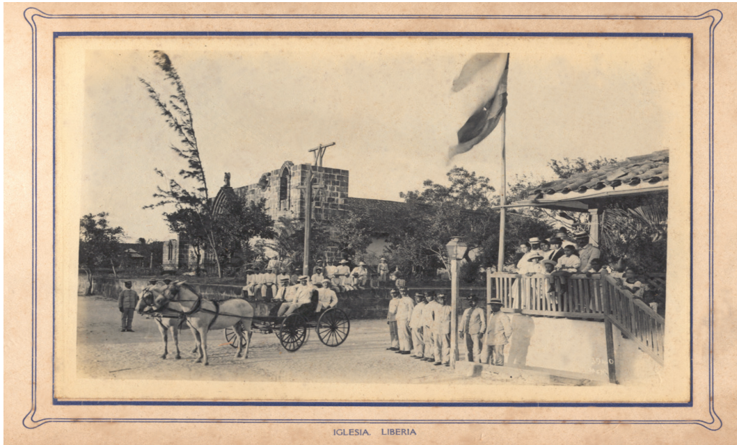
Figura 1: Antigua parroquia de Liberia. 1916

parroquial. Dicho edificio presentó en sucesivas ocasiones desperfectos en su tejado y sobre todo en su fachada principal. De hecho en 1844, se dirigió una petitoria en la cual se le “suplica al supremo gobierno se digne conceder los arbitrios que crea convenientes para reedificar la Iglesia de esta ciudad que se halla amenazada”. 9