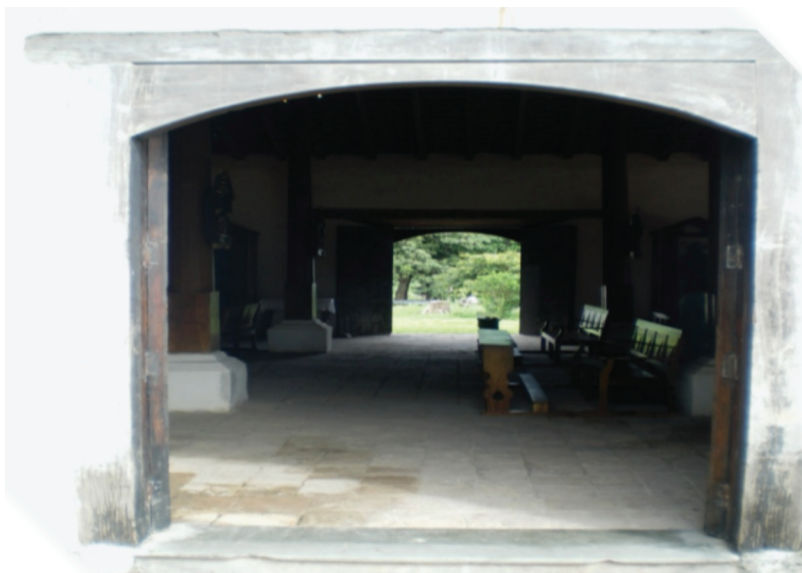
Figura 9: Fotografía puerta lateral.

Tanto la puerta principal como las dos laterales poseen tensores de esfuerzo a la altura tres metros y quince centímetros.