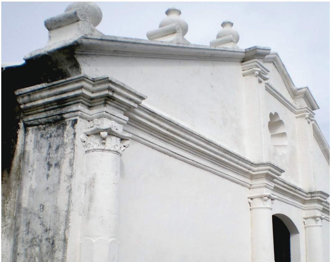
Figura 5: Fotografía fachada principal.

Tras quince años de extensos recorridos por todo el país y con un exilio de por medio, el obispo de Costa Rica, decidió realizar su cuarta visita pastoral por su Diócesis. En ésta, que sería su última visita por la provincia de Guanacaste, el pueblo liberiano le recibió con mucho júbilo, “el Ilustrísimo Sr. Obispo fue llevado triunfalmente por las principales calles de la ciudad, entre acordes de música, el estampido de la pólvora y el alegre repicar de las campanas, hasta la casa cural