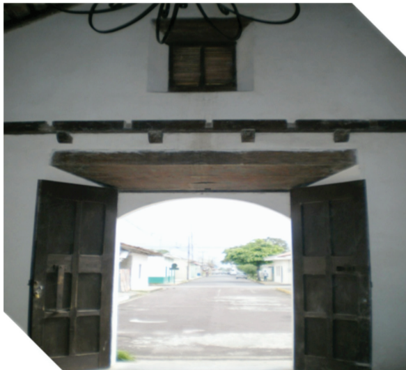
Figura 8: Fotografía puerta principal.