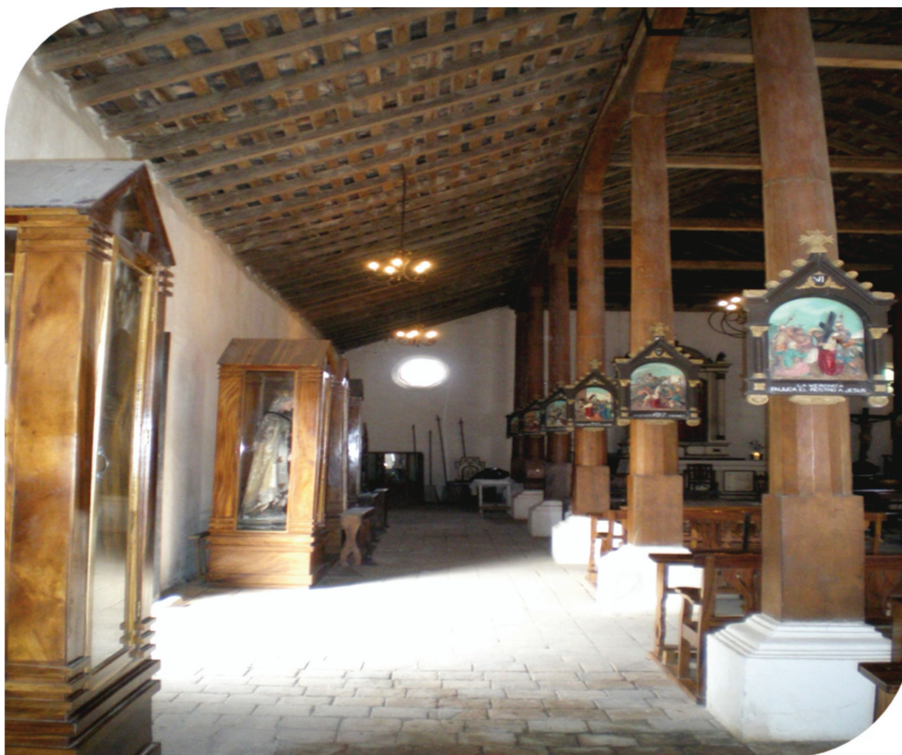
Figura 6: Fotografía interior.

Entre la pared principal y la posterior la estructura descansa sobre catorce soportes de madera de seis metros, cimentados sobre la loseta de barro. Dichos soportes mantienen en primer término el reglado, y luego las tejas del techo.