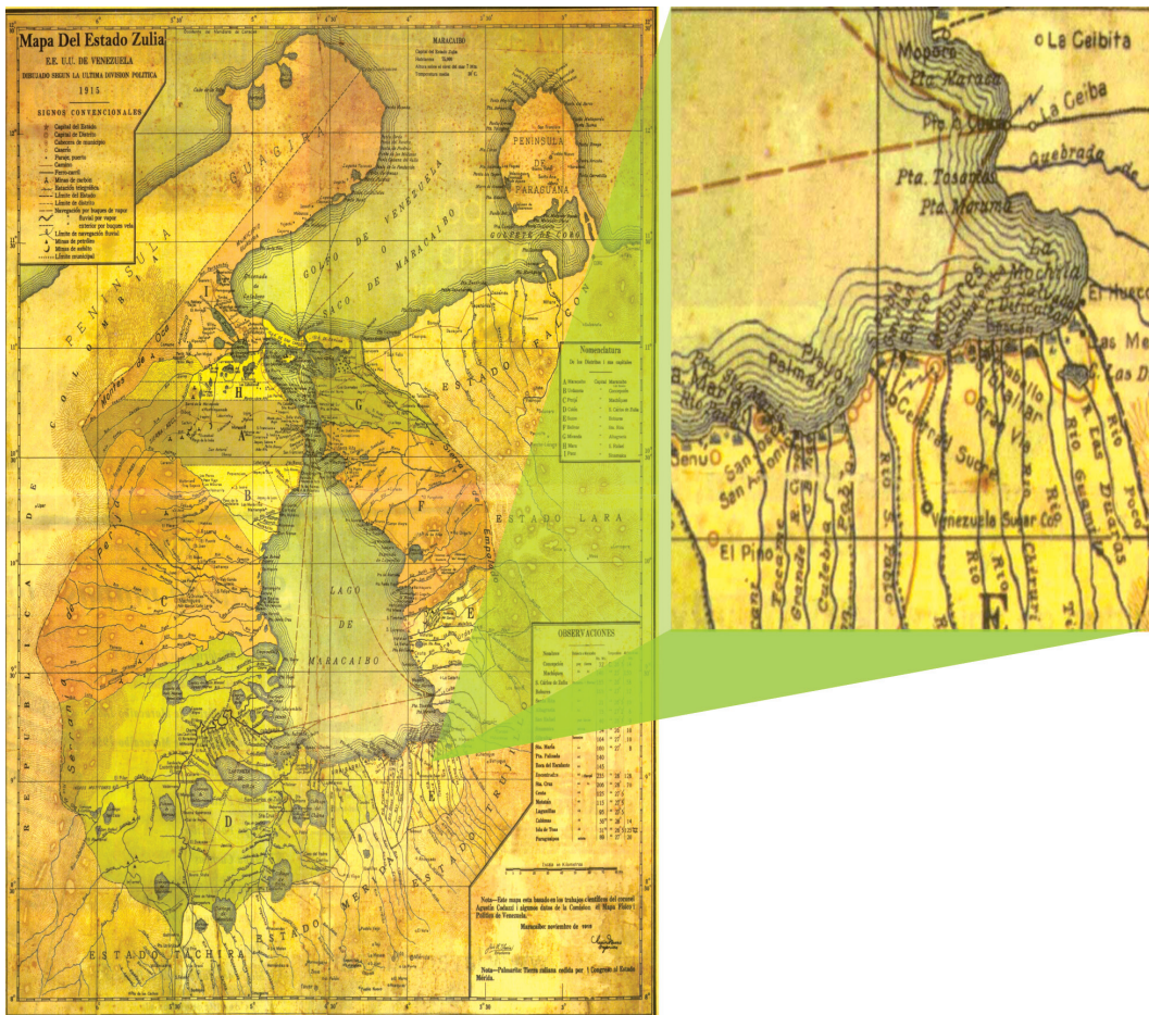
Figura 1. Mapa 1. Localización de las compañías anónimas azucareras en el Sur del Lago de Maracaibo en Mapa Histórico del estado de Zulia del año 1915.

El precio de la compra-venta fue de 200.000 bolívares que Domingo Carroz recibiría al instalarse el central azucarero en los terrenos comprados, y “siempre que los inmuebles vendidos por esta escritura fuesen utilizables, a juicio de aquellos promotores del Central, para beneficio de éste, pues en caso contrario quedará sin ningún valor ni efecto si dentro del término de dieciocho meses, a contar desde hoy no se hubiere empezado a fundar el supradicho Central” 8 . Carroz tomó posesión material y la administración de las propiedades, sin obligación de rendir cuenta a los compradores hasta la cancelación de los mismos, comprometiéndose a entregar las haciendas y terrenos en perfecto estado; durante su administración la compañía iniciaría los trabajos de construcción del central.