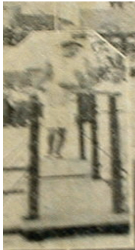
Figura 3 Joven liceísta ejecutando ejercicio en las barras paralelas

Las instituciones educativas siguieron siendo el espacio por excelencia para la difusión de la gimnasia, mientras que en otras latitudes latinoamericanas, como en Buenos Aires, los parques se constituían en semillero de gimnastas gracias a la colocación de aparatos de hierro. 66 En marzo de 1930, el Liceo de Costa Rica tributó un homenaje a los integrantes de las asociaciones deportivas Gimnástica Española y Fortuna. Se realizaron diversas manifestaciones deportivas entre las que se destacaron los ejercicios en aparatos de gimnasia, particularmente en las barras paralelas (fotografía 3) y el potro (fotografía 4). 67