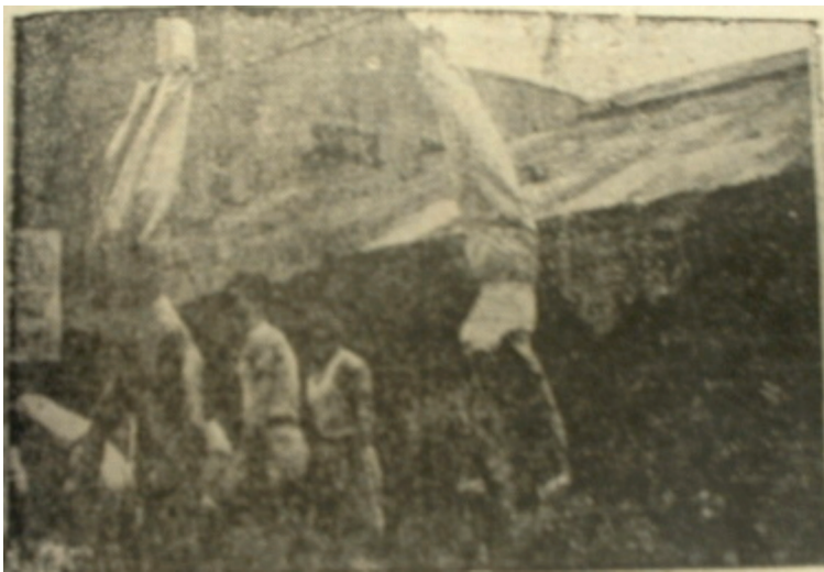
Figura 5. Gimnastas del Gimnasio Águila ejecutando una exhibición para el Día del Deporte (1949)