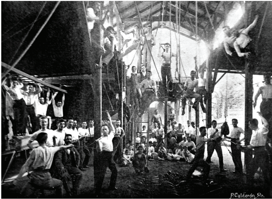
Figura 1. Gimnasio Municipal de San José (1901)