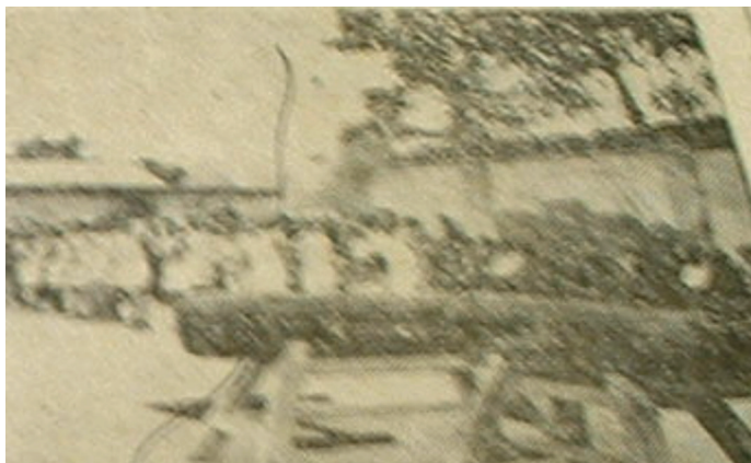
Figura 4. Liceísta ejecutando un salto sobre el potro

Además de los centros educativos, en las décadas de 1930 y 1940 surgieron asociaciones deportivas cuya infraestructura hacía posible la práctica de la gimnasia. Entre las más célebres destacan la Academia Nacional de Cultura Física Olimpia (1932), fundada por el empresario inglés Reuben R. Gomes, quien residió en Costa Rica entre 1923 y 1934. Gomes representó los intereses de varias firmas extranjeras establecidas en San José y aprovechó su estadía para promover las prácticas deportivas mediante la publicación de la revista Deportes y el establecimiento de El Centro de Sport (La Casa del Deportista), local dedicado a la venta de artículos deportivos. Además de la gimnasia, la Academia Olimpia promovió la natación, el boxeo, el béisbol, el tenis de mesa y los billares. 68