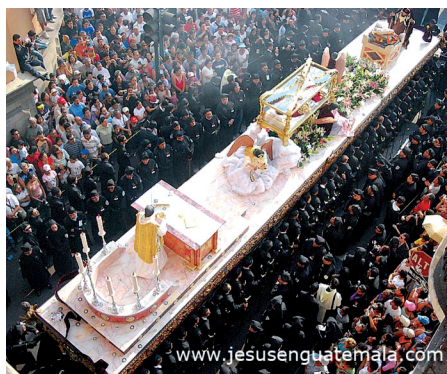
Figura 3. Ritual público.

Podría sugerirse desde una mirada superficial que quienes participan en este ritual, son únicamente los católicos; pero precisamente el hecho de ser un ritual público, por las vías públicas de la comunidad, provocan que tanto católicos como no católicos tengan variadas cuotas de relación o participación, puesto que además de concebirse como un ritual popular, las procesiones pasan a ser parte del espectáculo público de la época.