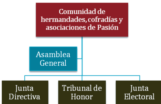
Figura 7. Instancias de la Comunidad de Hermandades.

De la estructuración de la Comunidad de Hermandades (Ver figura 7), considerándose esta como la asociación mayor en la que convergen una gran cantidad de cofradías, es interesante comprender su funcionamiento. Se diría que todas las cofradías comparten características que posee esta Gran Asociación 29 .