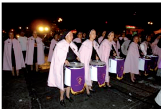
Figura 10. Hermandad de Mujeres.