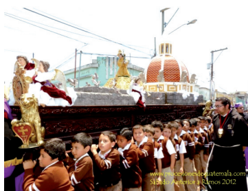
Figura 9. Procesión Infantil.

Para esto las cofradías, velando por el mantenimiento temporal, coadyuvan en el proceso de identificación de los niños con las prácticas religiosas, propias de la Semana Santa. Se llevan a cabo durante el año, y sobre todo en los tiempos de Cuaresma y Semana Santa, procesiones con réplicas infantiles de Jesús Nazareno y de la Virgen, los cuales son cargados por niños y niñas.