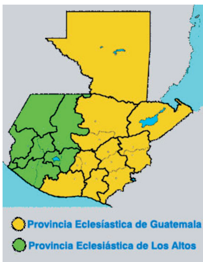
Figura 1. División Eclesiástica en Guatemala.

La Arquidiócesis de Guatemala, encerrada con azul en la figura 1, está integrada por dos departamentos: Guatemala y Sacatepéquez, el primero es el más extenso.