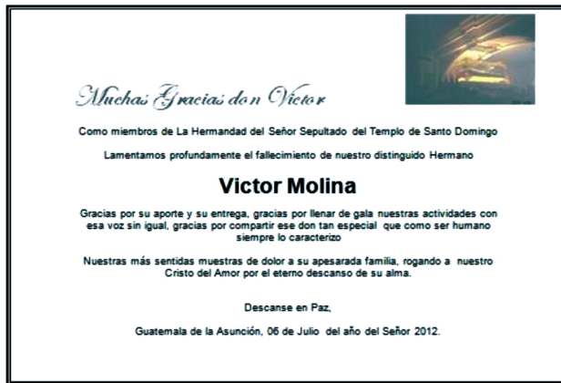
Figura 4. Fallecimiento de un Hermano.

haber, injustificadamente, suspendido el derecho de “una misa por la intención de su alma, al ocurrir su fallecimiento” 23 .