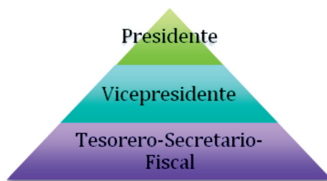
Figura 6. Estructura básica del organismo administrativo de la cofradía.