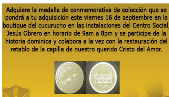
Figura 8. Medallas de colección.

Así también, la venta de medallas de colección por parte de la Hermandad del Señor Sepultado de Santo Domingo (Ver figura 8). Esta última cofradía además cuenta con una boutique en la cual ofrece otra serie de productos que incrementan el erario de la hermandad.