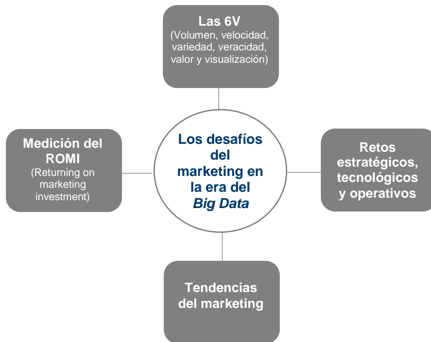
FIGURA 2 Los desafíos del marketing en la era del big data

En la Figura 2 se plantean cuatro desafíos clave para las empresas en lo referente al marketing en la era digital. El primer desafío son las propias características del big data , que están enmarcadas en la opinión de diferentes expertos (ver apartado 5.1) y se han reunido en 6V (volumen, velocidad, variedad, veracidad, valor y visualización). El segundo lo constituyen los retos estratégicos, tecnológicos y operativos que deben asumir las organizaciones para hacer frente al big data , su analítica y su utilidad para la toma de decisiones. El tercer reto son las tendencias de marketing que día a día vienen con más innovaciones y tecnologías aplicables. El último se plantea como el gran reto y la materia pendiente por parte de los departamentos de marketing, la medición del ROMI ( return on marketing investment ).