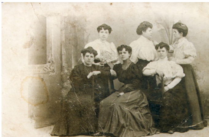
Foto de estudio de señoras residentes en Simat en 1892

Fuente: Fotografía tomada por la autora de la Colección Local Biblioteca Pública de Simat.