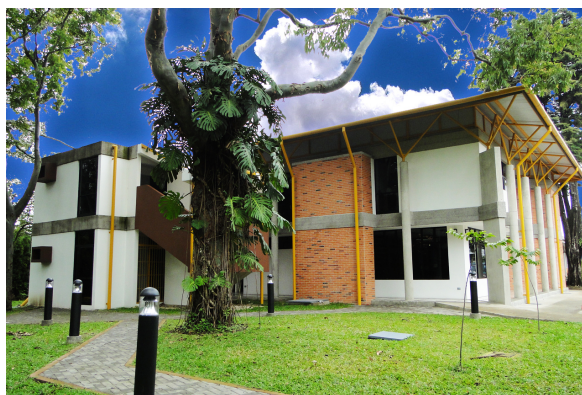
Figura 1. Escuela de Bibliotecología y Ciencias de la Información

El presente documento pretende dar a conocer los principales logros en una de las áreas sustantivas del quehacer universitario, cual es la INVESTIGACION, entendida como la producción teórica y aplicada de nuevo conocimiento en la disciplina bibliotecológica. Para situarse en el contexto, es importante ubicar esta actividad desde un plano más micro, caso particular, dónde se enmarcan los proyectos de investigación de la Escuela de Bibliotecología y Ciencias de la Información en la Universidad de Costa Rica. Por otra parte, se abordarán otros puntos, de la estructura y organización de la actividad investigadora que orientan la investigación científica en la Escuela de Bibliotecología y Ciencias de la Información.