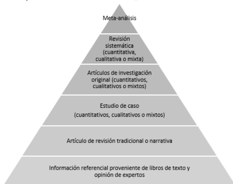
Figura 3 Jerarquía de la evidencia científica en ciencias sociales