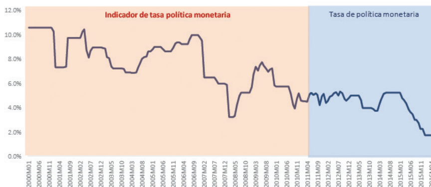
GRÁFICO 1 COSTA RICA: TASA DE POLÍTICA MONETARIA