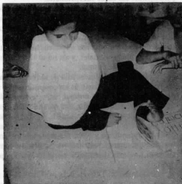
Fig. 1: Niña con problemas neuro músculo esqueléticos. Realiza todas sus actividades con sus pies (no tiene brazos). Después de haber pasado cierto periodo en una escuela para este tipo de problemas, se le integró al sistema educativo regular. Actualmente cursa el Tercer Grado en una escuela de Guadalupe (1977).

Se aconseja igualmente incluir a otro grupo de niños que sin estar comprendidos en las categorías anteriores tienen sin embargo dificultades en las condiciones ordinarias en el proceso de enseñanza