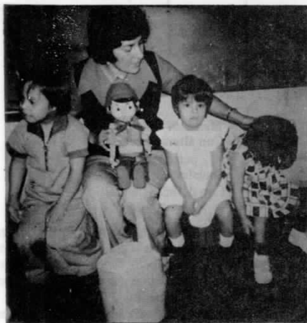
Fig. 2: Grupo de niños de la Escuela de Enseñanza Especial de San Isidro de El General, Retardo Mental. Programa de estimulación precoz.

De lo escrito anteriormente viene la duda: ¿Es la Educación Especial verdaderamente una parte del sistema educativo, o una empresa totalmente aislada para los niños, jóvenes excepcionales? Algu-