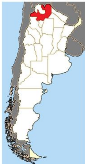
Figura 1. Provincia de Salta