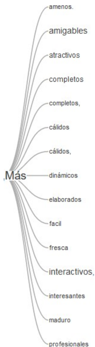
FIGURA 2 Visión de sus entornos virtuales luego de transitar el taller ATP. Elaboración propia, se usó Voyant Tools.

Por el contrario, tras haber transitado el ATP expresaron una visión positiva evidenciada en la reiteración de la palabra más, que realmente propiciaba la interacción, la creatividad, el aprendizaje a partir de haberse hecho presentes con intención pedagógica en los espacios virtuales. El análisis de los significados que el colectivo asignó a sus espacios virtuales antes y después de transitar los talleres permiten, desde una visión etnometodológica, comprender que hubo una transformación y que fue valorada como positiva por los participantes.