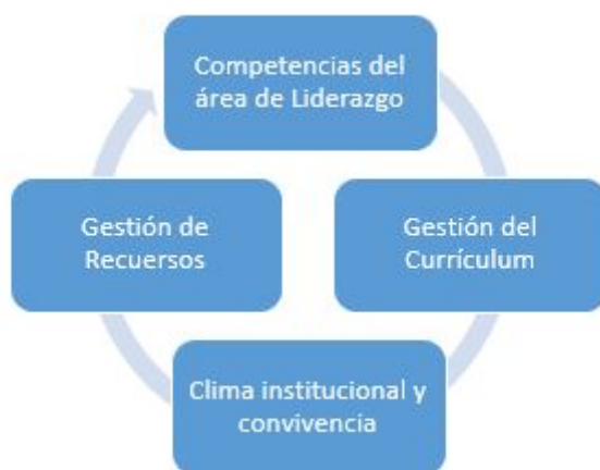
FIGURA 1 Perspectiva del Liderazgo en MBD

La perspectiva de liderazgo que propone el MBD (MINEDUC, 2005) define al liderazgo directivo a partir de un conjunto de competencias que coadyuvan al logro de los criterios de las otras áreas de gestión, posicionándolo como el dominio motor del marco. (Ver Figura 1)