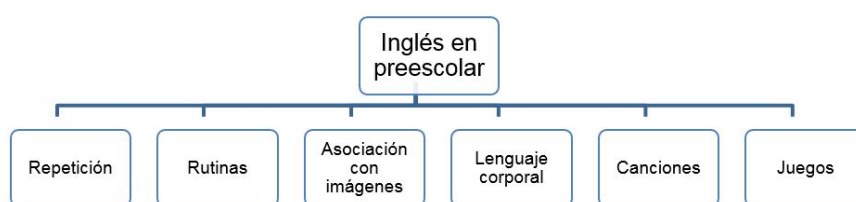
FIGURA 1 Elementos presentes en la metodología del aula

Estos elementos se refieren a los aspectos más reiterativos en todas las clases, con lo cual se convierten en técnicas comunes en la enseñanza del inglés a nivel preescolar. A continuación, una referencia más detallada sobre cada uno de ellos.