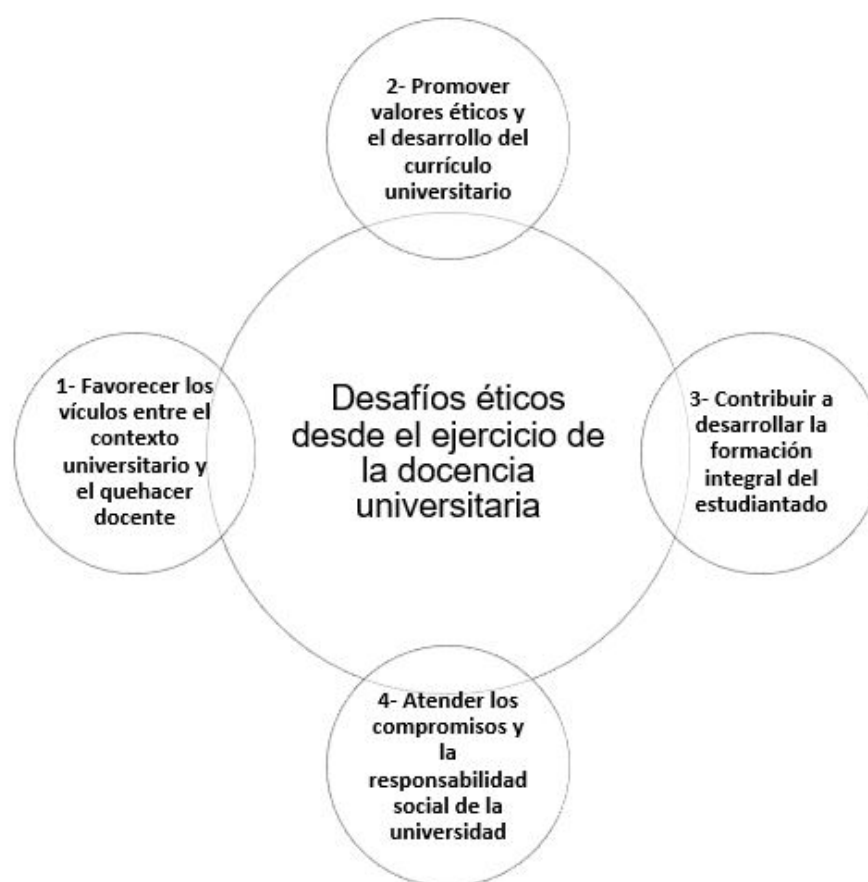
FIGURA 1 Desafíos de la docencia universitaria Elaboración propia

En relación con el contexto universitario y su vínculo con el quehacer docente, la universidad pública latinoamericana debería dialogar con los grupos sociales para coadyuvar a la atención de problemas complejos que implican la formación de personas con compromiso social y humano, atendiendo a la vez las necesidades del profesorado. Por ello, para la comunidad universitaria es preciso contar con condiciones óptimas de infraestructura universitaria, una excelente mediación pedagógica y sobre todo experiencias innovadoras más allá del salón de clases (Carvajal, 2013).