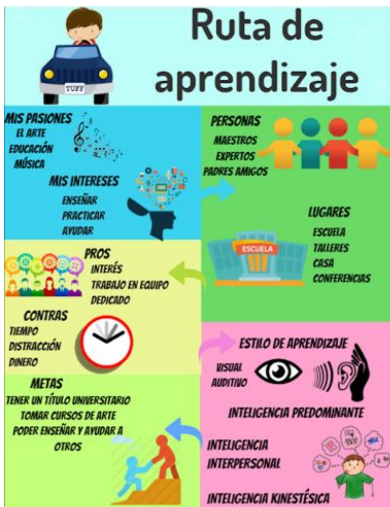
FIGURA 2 Ejemplo de infografía para representar las RA

A través de las infografías, las personas aprendientes expresaron con elementos textuales y visuales, las deconstrucciones de las RA a través de procesos reflexivos de conexión entre la inducción y el ingreso para dar nuevos sentidos y significados.