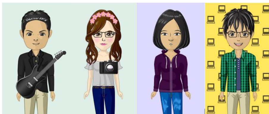
FIGURA 1 Ejemplos de avatares identitarios.

Esta integración entre lo presencial y lo virtual demostró que las y los estudiantes viven, conviven y aprenden en dos realidades la virtual y la presencial. El avatar presentado en la Figura 1, fue elaborado con aplicación web avachara .