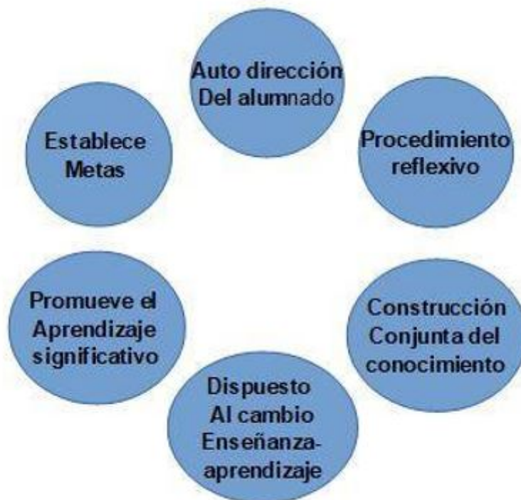
FIGURA 1 Características de un/a docente constructivista

El profesorado con enfoque constructivista, permite que el estudiantado autodirija su aprendizaje, estableciendo metas claras con procedimientos reflexivos, y de manera conjunta construir el conocimiento. Este debe estar dispuesto al cambio, promoviendo el aprendizaje significativo. Desde tal perspectiva, los ámbitos educativos se han visto enriquecidos por la incorporación de las tecnologías que se pueden usar con propósitos claros, para que el estudiantado pueda autodirigir sus esfuerzos y construir sus aprendizajes. De esta manera, se permite generar un ambiente de libertad para crear y construir los proyectos de manera libre, vinculando así mismo el mundo real con el aprendizaje continuo. Para Hernández (2008):