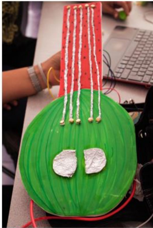
FIGURA 3 Guitarra elaborada con material reciclado