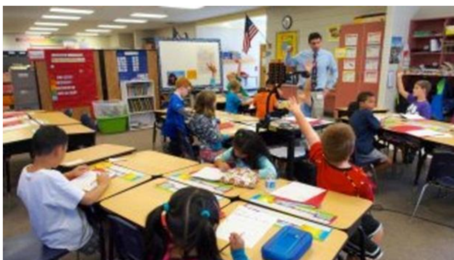
FIGURA 5 Imagen 4 de 37. Clase, docente y estudiantes

A continuación, se presenta la Figura 5, segunda en frecuencia de elección: