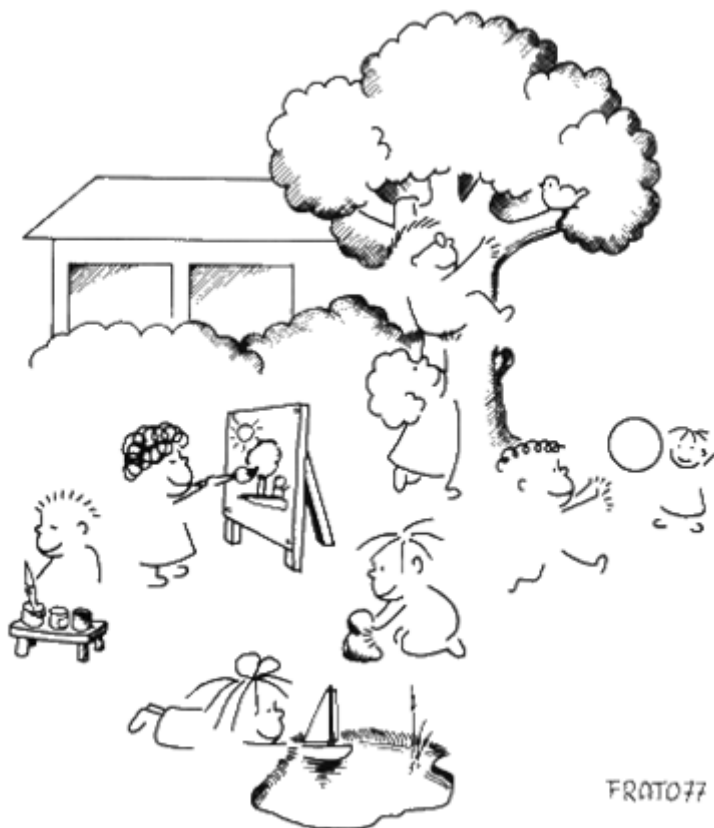
FIGURA 4 Imagen 18 de 37. Niños/as en un parque

En primer término, se muestra la Figura 4: