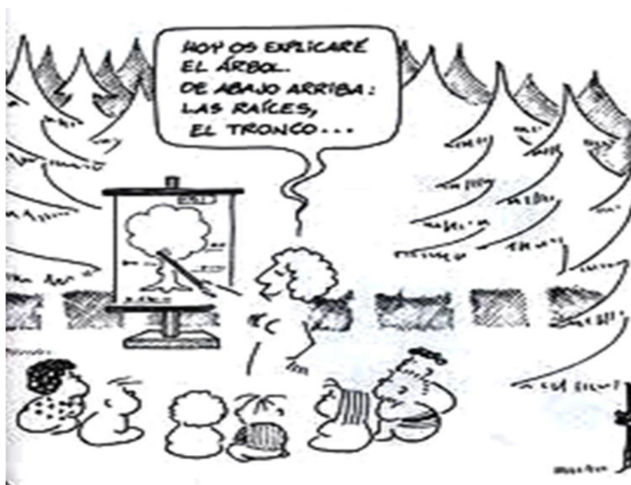
FIGURA 6 Imagen 3 de 37. Docente y estudiantes en el bosque Fuente: Tonucci (1985, p.123)