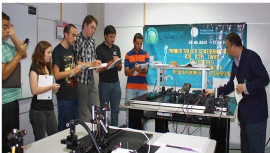
FIGURA 7 Imagen 7 de 37. Clase Taller