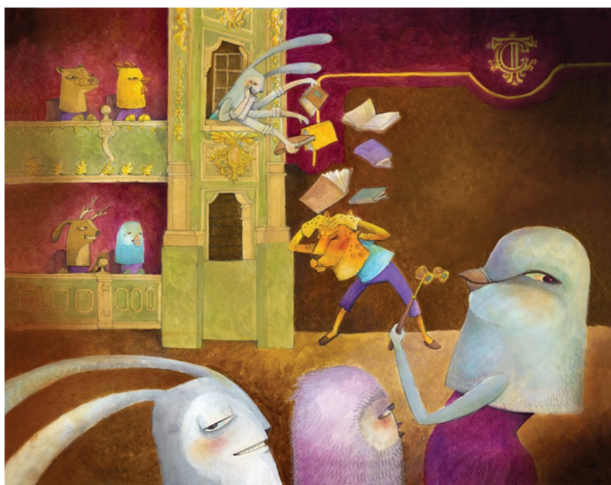
FIGURA 5 Ilustración de Ruth Angulo