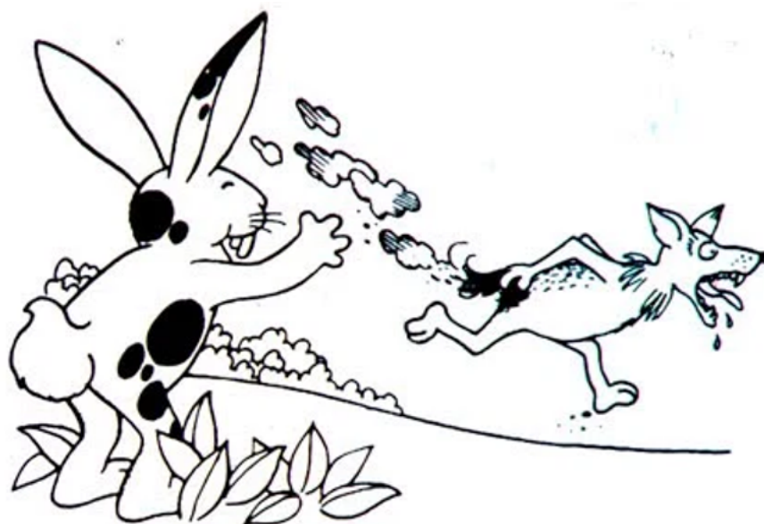
FIGURA 4 Ilustración de Hugo Díaz Fuente: Lyra (1999, p. 119)

Educa (Lyra, 1999) y actualmente la da a conocer la Editorial Legado. Díaz también iluminó una versión de La Cucarachita Mandinga , en 1998, completamente en color (ver Figura 4).