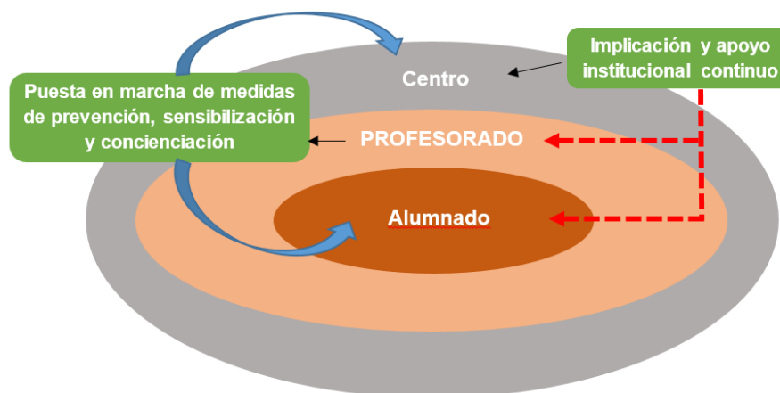
FIGURA 1. Posición del colectivo docente en la comunidad académica

una posición complicada, a la par que privilegiada, que le exige, por una parte, poner en marcha mecanismos de control, denuncia e información al alumnado sobre el alcance de estas prácticas y, por otra, reclamar al centro medidas de concienciación, sensibilización y formación que ayuden a contrarrestarlas.