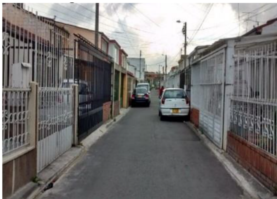
FIGURA 8. Calles internas de algunos sectores del barrio en la actualidad

En la actualidad, los jardines y los andenes de las calles han desaparecido en algunos sectores del barrio, pues los propietarios han tomado el espacio para construir garajes, de modo que solo se conservan las vías como acceso para los carros. (Figura 8).