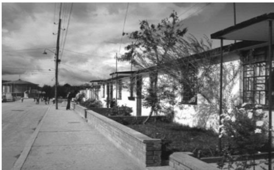
FIGURA 3 Carrera 73ª. Año 1958

En sus orígenes, la carrera 73ª era netamente peatonal y transitada principalmente por quienes habitaban el barrio y sus visitantes. El diseño original de las casas, de un solo piso, incluía jardines y contaba con andenes para el desplazamiento de transeúntes (Figura 3).