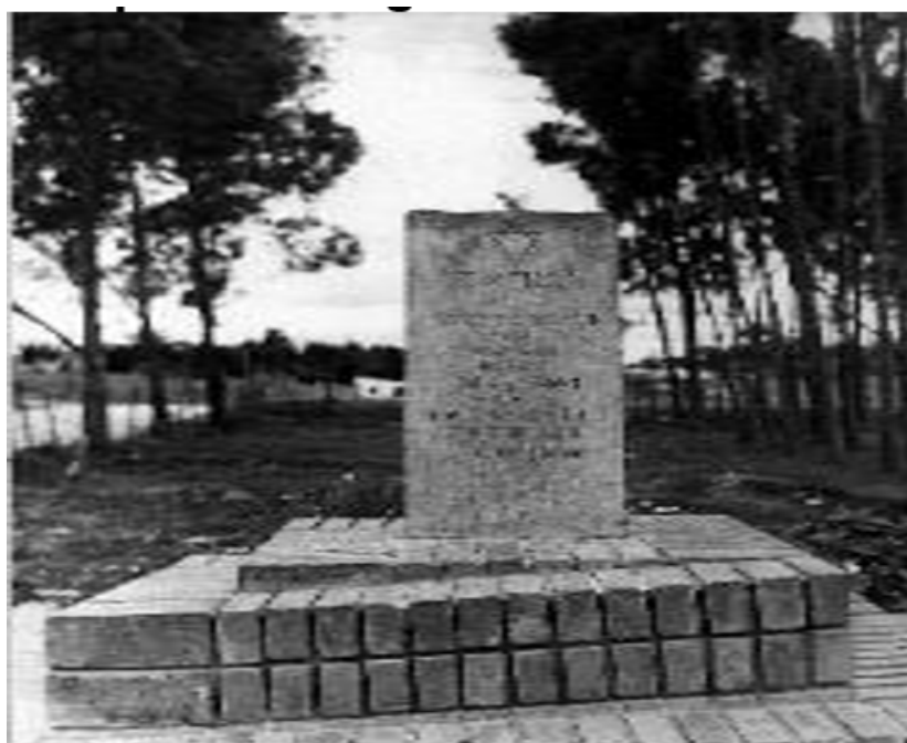
FIGURA 5 El monumento de la Avenida Weissman en el espacio público original del barrio. Año 1967

El espacio público del barrio adquiriría un significado histórico y simbólico para los habitantes, pues allí se conservaba la evidencia de eventos significativos en el desarrollo del proyecto urbanístico. Tal es el caso del monolito instalado en 1967 (Figura 5) en una ceremonia comunitaria en una de las calles del barrio, con el cual la comunidad reconoció el apoyo que el Estado de Israel brindó en su construcción, razón por la cual esta calle se denominó Avenida Presidente Weissman.