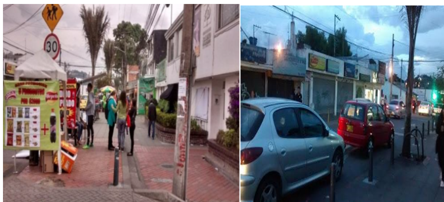
FIGURA 4. Avenida Cristo Rey o Carrera 73ª

En la Figura 4 se aprecia que la carrera 73ª actualmente es transitada por vehículos; por sus andenes se presenta un alto flujo de transeúntes que, en su mayoría, son estudiantes y personal que labora en la universidad; las casas han cambiado su carácter residencial por uno comercial pues los jardines fueron transformados en locales que ofrecen productos y servicios a los transeúntes del sector.