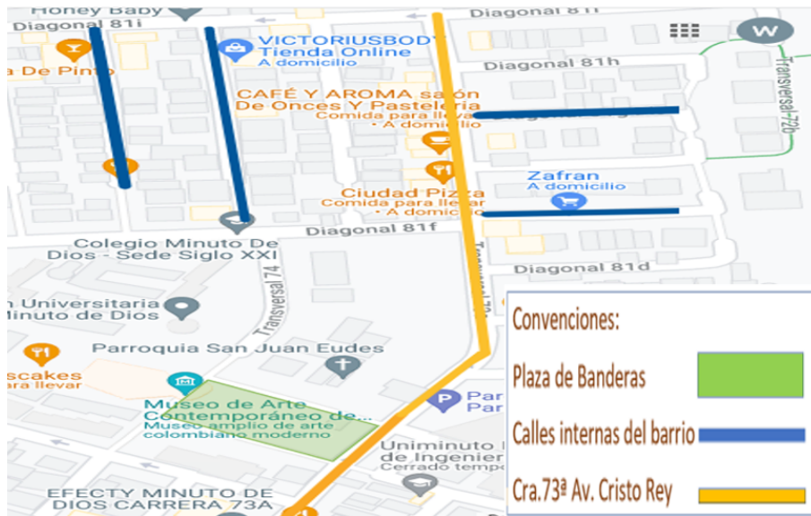
FIGURA 2 Puntos de observación en el barrio Minuto de Dios.

En primer lugar, el portafolio fotográfico permitió establecer la transformación del espacio público del barrio de lugares que fueron emblemáticos en el barrio original. Para este registro, se seleccionaron la carrera 73ª que era principal vía de acceso al barrio; la plaza de Banderas, lugar emblemático del barrio en el que se desarrolló gran parte de la actividad comunitaria de los habitantes fundadores; el monolito de la Avenida Weissman, pues es de los pocos referentes históricos que aún pervive en el barrio y representó el apoyo de la nación de Israel para el desarrollo del barrio; y, por último, las calles internas del barrio de las primeras etapas, en las que se instalaron las personas habitantes fundadoras, donde ocurría frecuente interacción comunal.