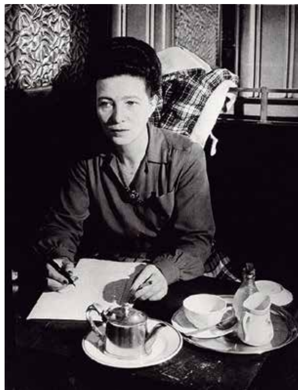
Simone de Beauvoir.

En este punto es importante distinguir entre los filmes de mujeres o melodramas [women's films] y el cine de mujeres [women's cinema]. El cine de mujeres es una tendencia, mientras que los filmes de mujeres son productos específicos (un conjunto simple de producciones que no conforman una tendencia). El término filmes de mujeres se refiere a las producciones de Hollywood supuestamente diseñadas para el público femenino. Este género fue muy popular durante la década de 1930, 40 y 50. Los filmes de mujeres están tipificados como melodramas, en la medida en que la trama, los personajes y muchos elementos estéticos, son presentados en términos de las tradicionales y conservadoras concepciones de las mujeres y su posición en la sociedad. María Laplace lo explica de la siguiente manera: