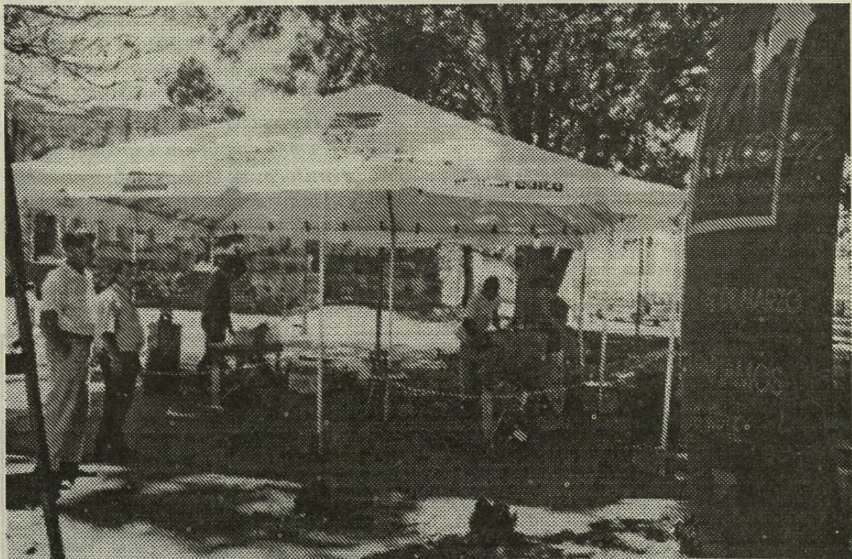
Escultores en el parque central de Cartago.

“Del 15 al 22 de marzo de 1997 la alegría se desbordará. Con mascaradas y bombetas un importante acontecimiento nos unirá en Cartago. Desde diversas regiones del país numerosos artistas llegarán a esta provincia con sus mejores obras para darlas a conocer en un gran festival.