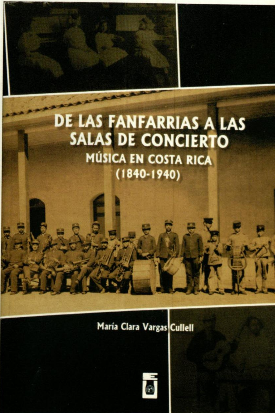
Portada del libro "De las fanfarrias a las salas de concierto". Música en Costa Rica (1840-1940).