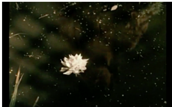
Imagen 5. La flor en el flashback en Cuando los ángeles caen