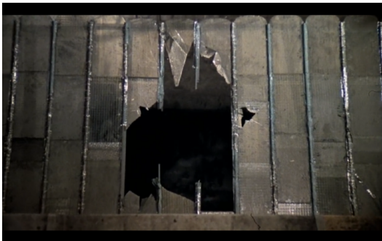
Imagen 9. El techo de baldosas en El quimérico inquilino

En el caso de la historia de Trelkovsky, también apreciamos ese techo de baldosas (Imagen 9) como catalizador de dos mundos y, del mismo modo, dos realidades que viven en la cabeza del protagonista. A diferencia del corto, aquí el operador escenográfico obedece a una estructura circular narrativa que, según algunos autores es propia del cine de Roman Polanski, puesto que “con las honrosas excepciones de Chinatown (Roman Polanski, 1974) y La novena puerta (Roman Polanski, 1999) ... todas sus películas conformarán un círculo perfecto” (Feeney & Duncan, 2006, p. 16). El techo de baldosas es la primera pieza que Trelkovsky conocerá de su patio de vecinos y también la última.