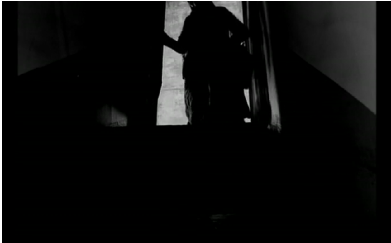
Imagen 3. Acceso al baño/ No-Hogar en Cuando los ángeles caen

plano del acceso (Imagen 3), quedan remarcadas por la iluminación las notables limitaciones del espacio: una vez más, la sensación claustrofóbica se hace con el sentido visual de la imagen, del mismo modo que se antecedió en la presentación del cortometraje.