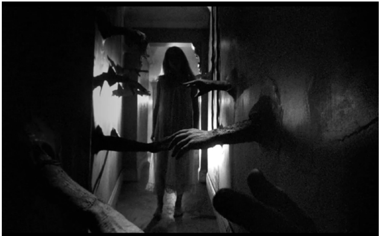
Imagen 4. Acceso al baño del No-Hogar en Repulsión

Cada objeto está cargado de significación ... la acción condensa los hechos sin retener sino lo que tienen de esencial. ... Los objetos más simples, la puerta giratoria, los uniformes son otros tantos signos (p. 280).