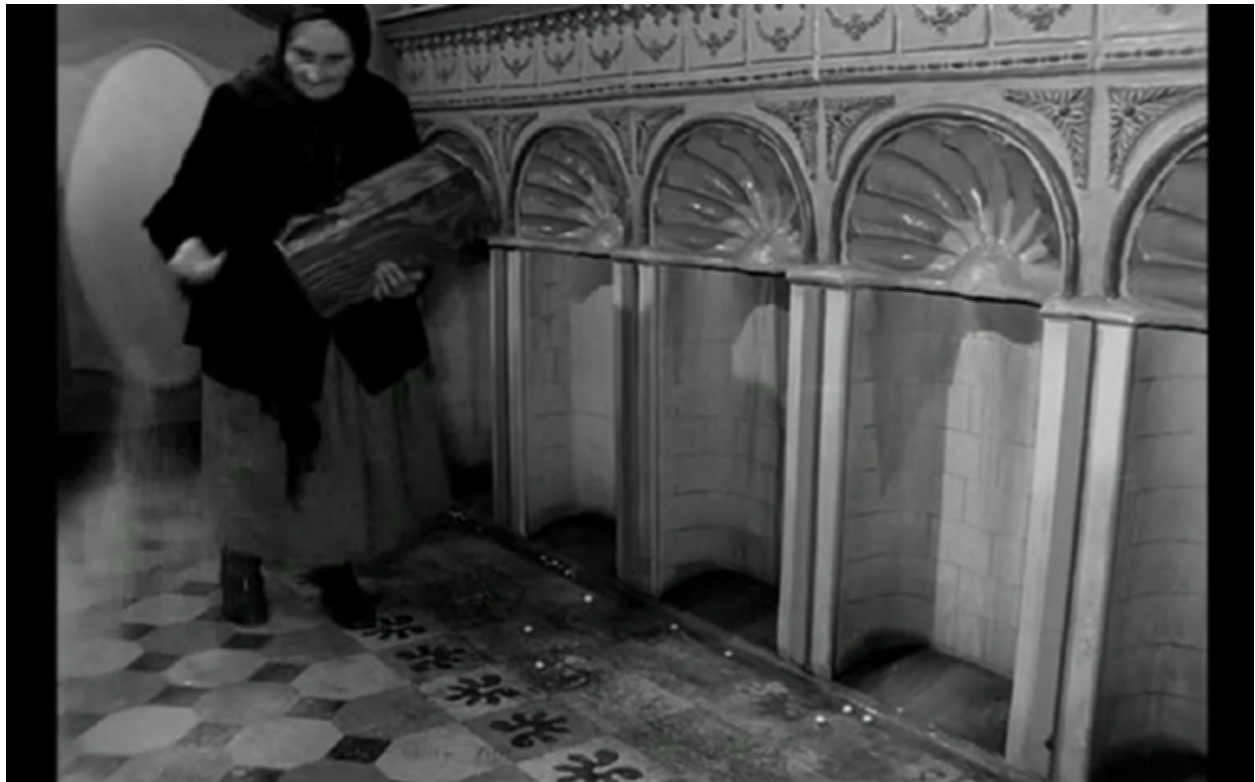
Imagen 10. El No-Hogar como refugio en Cuando los ángeles caen .

refugio de la protagonista, del mundo exterior masculino, como bien reflejan las acciones de la ella en el habitáculo, ya que es el “espacio en el que se limpia de la realidad masculina de afuera” (Padilla Díaz, 2017, p. 150).