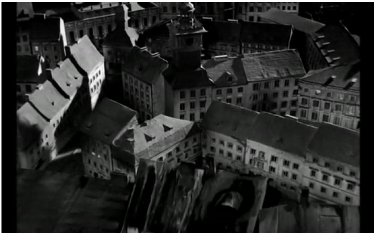
Imagen 1. Panorámica de la ciudad de Cracovia al inicio de Cuando los ángeles caen

Fuente: Cuando los ángeles caen (Gdy Spadaja Aniol) Roman Polanski, 1958.