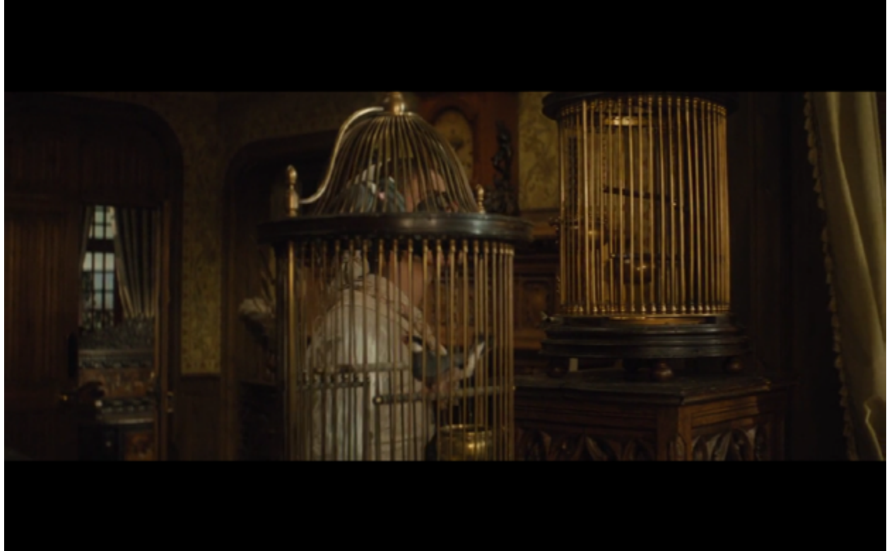
Imagen 11. Las jaulas de oro enmarcando y pronosticando el futuro de Tess