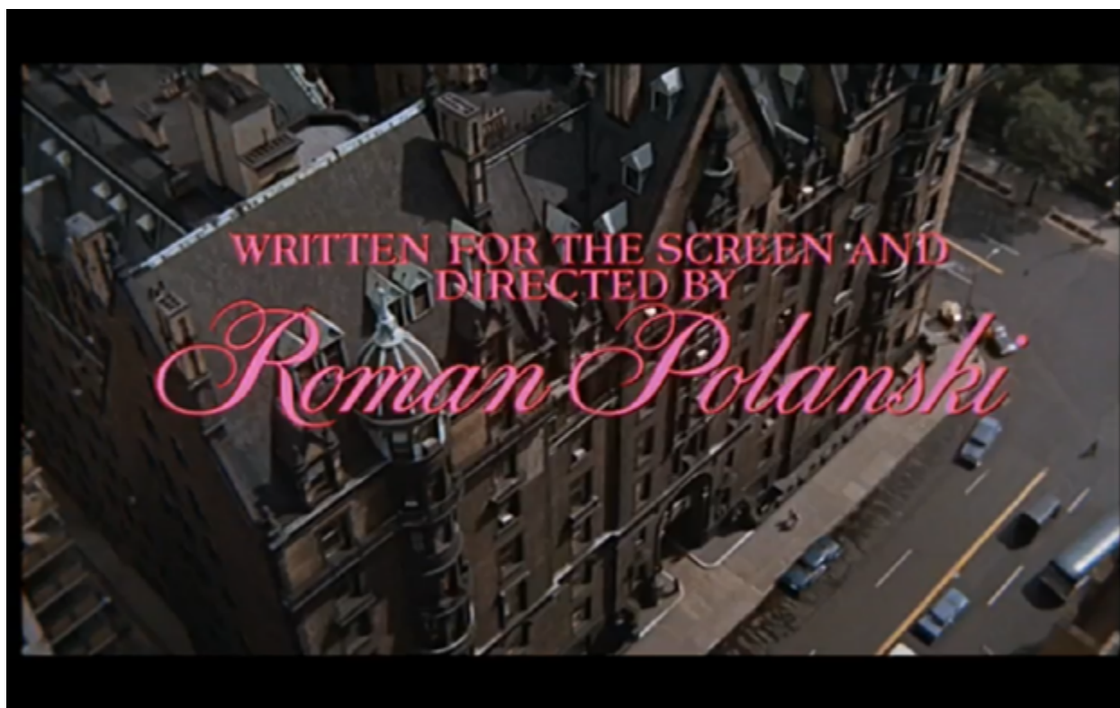
Imagen 2. Panorámica de la ciudad de Nueva York al inicio de La semilla del diablo .

La apertura tiene mucho que ver con el significado del film: en un ambiente cosmopolita y luminoso, emerge el oscuro y misterioso edificio Bramtford. La extrañeza visual del Bramtford, que parece un inmueble fuera del tiempo y del espacio, está relacionada con los acontecimientos que más tarde allí se desatan, con el hecho de que en una ciudad de los 60, existían ritos antiguos como la brujería y el satanismo (p. 26).