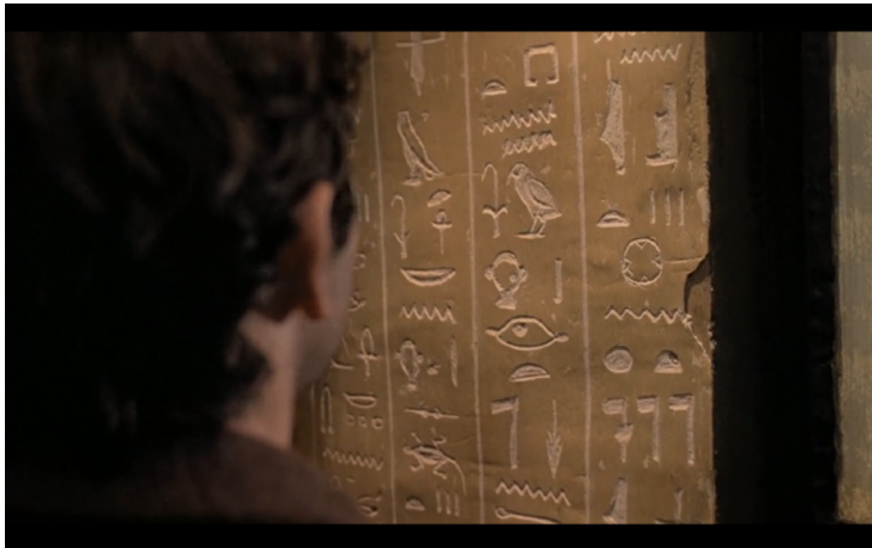
Imagen 7. Jeroglíficos egipcios en el baño de El quimérico inquilino