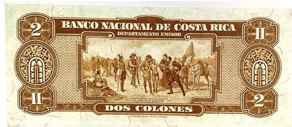
Imagen 10. Billete de dos colones, Banco Nacional de Costa Rica, Serie E, 1941