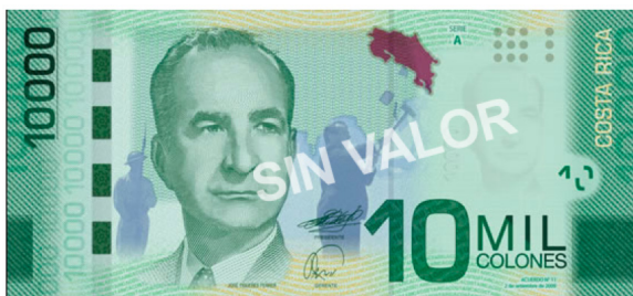
Imagen 21. Anverso del billete de 10 000 colones