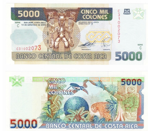
Imagen 12. Billete de 5 000 colones, Serie C, 1991-2008

Fuente: Banco Central de Costa Rica, billetes retirados de circulación.