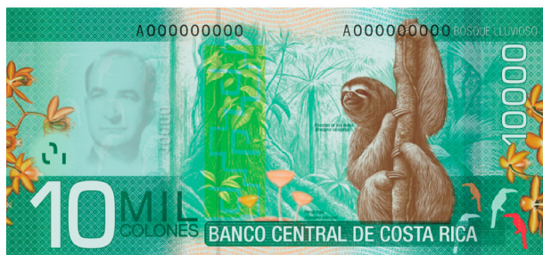
Imagen 22. Reverso del billete de 10 000 colones