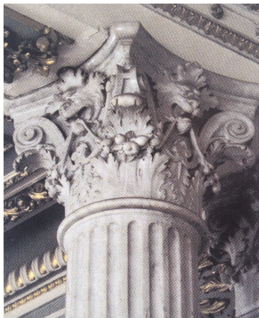
Imagen 1. Capitel de columna estilo corintio, decorado con acantos. Teatro Nacional de Costa Rica, 1897

En el papel moneda costarricense encontramos, entonces, el uso de recursos clásicos europeos utilizados en la representación académica, tendencias estilísticas del arte plástico del Barroco, del Neoclásico y del Romanticismo europeo. Estos estilos se caracterizan por su interés en retomar la estética del clasicismo grecorromano, desarrollada durante el Renacimiento. Épocas caracterizadas por el interés en la representación del mundo natural: la figura humana, la arquitectura, el mundo natural. En este sentido, se retoman los recursos formales que posibilitan la representación del volumen y la perspectiva. Estos elementos los podemos encontrar presentes en los billetes en la trama lineal, que proporciona la ilusión de volumen, luz y sombra de los diferentes elementos temáticos representados. Además, se retoman elementos decorativos característicos de herencia europea grecorromana, caracterizados por la simetría, el equilibrio y la armonía. Asimismo, en la estética del estilo Barroco encontramos “la suntuosidad, el primor, la hermosura, lo pulido, la valentía, el lucimiento, lo costoso y la riqueza” (Justino Fernández citado por Fernández, 2014, p. 94). Estos valores los podemos encontrar en ciertos componentes suntuosos utilizados como elementos decorativos y en la composición del papel moneda en Costa Rica.