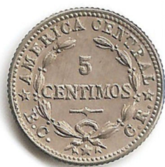
Imagen 3. Moneda de cinco céntimos, 1951

de laurel, lo cual indica que el personaje representado es laureado. Por su parte, la rama de encino es símbolo de la libertad.