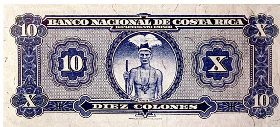
Imagen 7. Billete de 10 colones. Banco Nacional de Costa Rica, Serie F, 1941

Es necesario destacar que, a inicios del siglo XX, el arte precolombino o indigenista, en Costa Rica, fue anulado y menospreciado desde la óptica europea 10 (Montero, 2015, pp. 42-45). No solo debido a que es producto de la cultura colonizada, la cual fue subyugada y tratada como inferior desde la lógica de la otredad, sino que, además, el arte indigenista fue considerado como un conjunto de objetos arqueológicos y extraños desde la óptica europea. En la academia de arte en Latinoamérica, debido a la influencia del arte europeo, los estilos propios de este continente se impusieron como “buen diseño”, “equilibrado” y “armonioso”. Es este sentido, la mirada hacia el arte precolombino, a finales del siglo XIX e inicios del siglo XX, se da con la extrañeza y el exotismo de quien mira al otro, pues no se concebía lo indígena como una identidad propia del “ser costarricense” (Molina, 2005; Ferrero, 2004 y Solórzano, 2017). En la mayor parte de los billetes anteriores a la década de 1991, encontramos poca presencia del motivo precolombino como tema central (6 billetes del total de los emitidos por el BCCR, antes del año 2008). Los cuales reproducimos a continuación (Imágenes 7 a la 12):