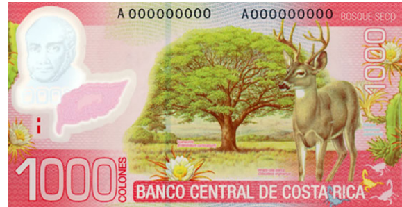
Imagen 16. Reverso del billete de 1 000 colones