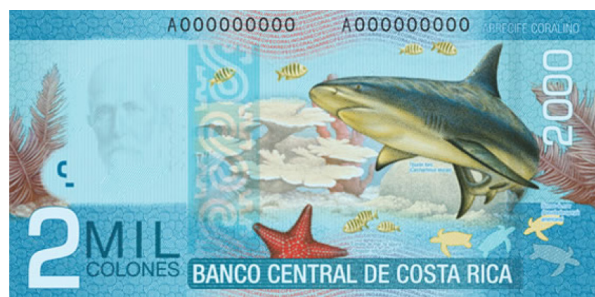
Imagen 18. Reverso del billete de 2 000 colones