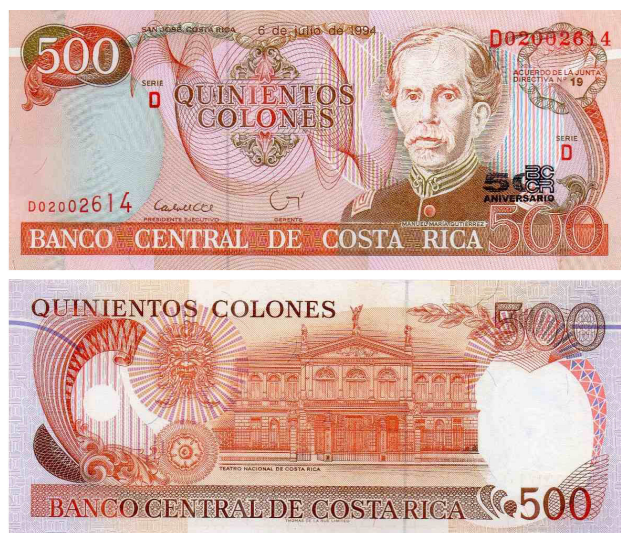
Imagen 2. Diseño del billete de 500 colones, emisión de 1979-1985. (Se reproduce una edición especial conmemorativa, emitida con el mismo diseño en 1994)