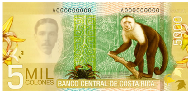
Imagen 20. Reverso del billete de 5 000 colones