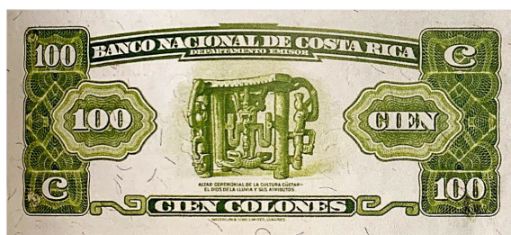
Imagen 8. Billete de 100 colones. Banco Nacional de Costa Rica, Serie F, 1942