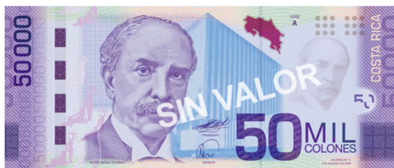
Imagen 25. Anverso del billete de 50 000 colones