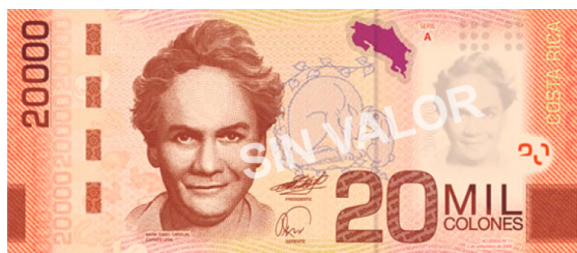
Imagen 23. Anverso del billete de 20 000 colones