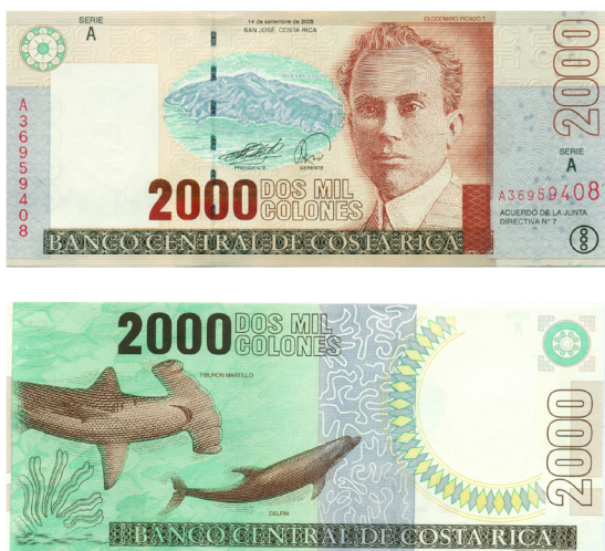
Imagen 13. Anverso y reverso del billete de 2 000 colones. Serie A, 1997-2008

Fuente: Banco Central de Costa Rica, billetes retirados de circulación.