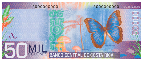
Imagen 26. Reverso del billete de 50 000 colones