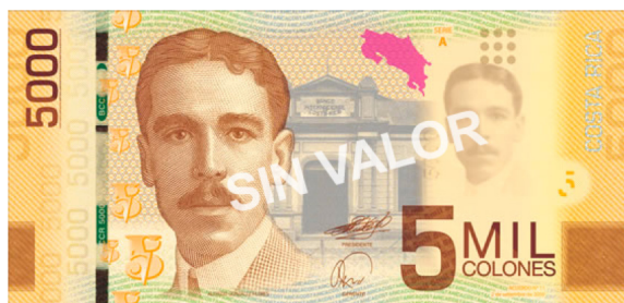
Imagen 19. Anverso del billete de 5 000 colones