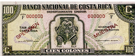
Imagen 9. Billete de 100 colones. Banco Nacional de Costa Rica, Serie F, 1942

El elemento temático precolombino se retoma en el billete de 5 000 colones (Imagen 12), en el que se diseña un conjunto de biodiversidad y arte indígena, al recuperar en el diseño dos estatuillas precolombinas de oro y piedra, así como una esfera. Además, se retoma el recurso en los elementos decorativos presentes en las esquinas del billete. Cabe destacar que este billete, al igual que el de cinco colones, rompe con la simetría tradicional del diseño europeo, lo cual resulta también un recurso novedoso.