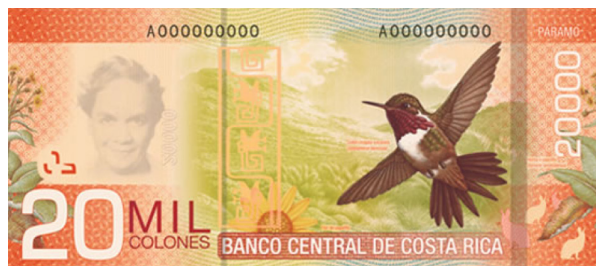
Imagen 24. Reverso del billete de 20 000 colones