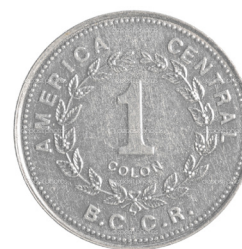
Imagen 5. Moneda de un colón