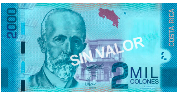
Imagen 17. Anverso del billete de 2 000 colones