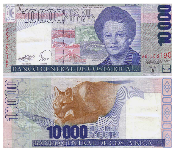
Imagen 14. Anverso y reverso del billete de 10 000 colones. Serie A, 1997-2008

Fuente: Banco Central de Costa Rica, billetes retirados de circulación.