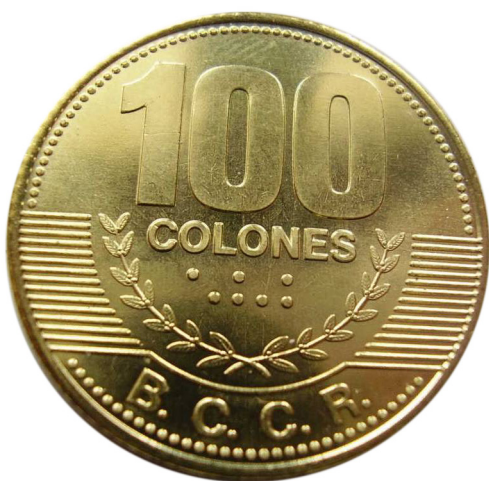
Imagen 6. Moneda de 100 colones, 1995

A partir de 1847, se empieza a utilizar en la numismática el tema del café (el cultivo, la rama, la flor y el fruto), debido a la importancia de este como producto de exportación. La temática la podemos visualizar, claramente, en reverso del billete de cinco colones (Imagen 4),