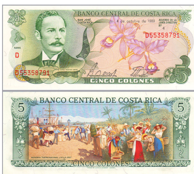
Imagen 4. Diseño del billete de cinco colones, 1968-1992