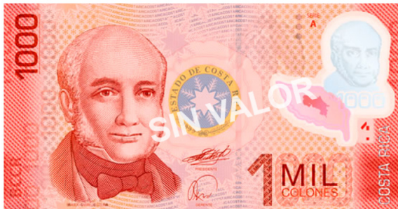
Imagen 15. Anverso del billete de 1 000 colones