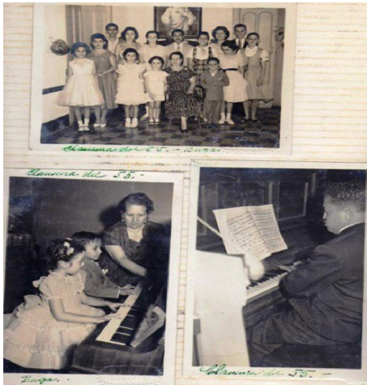
Figura 3. Clausura de 1955 en la academia de estudios musicales