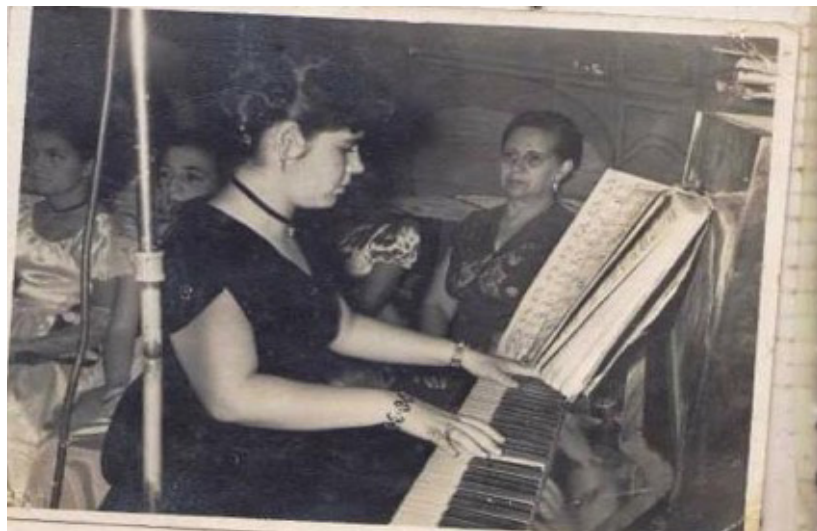
Figura 5. Transmisión radial