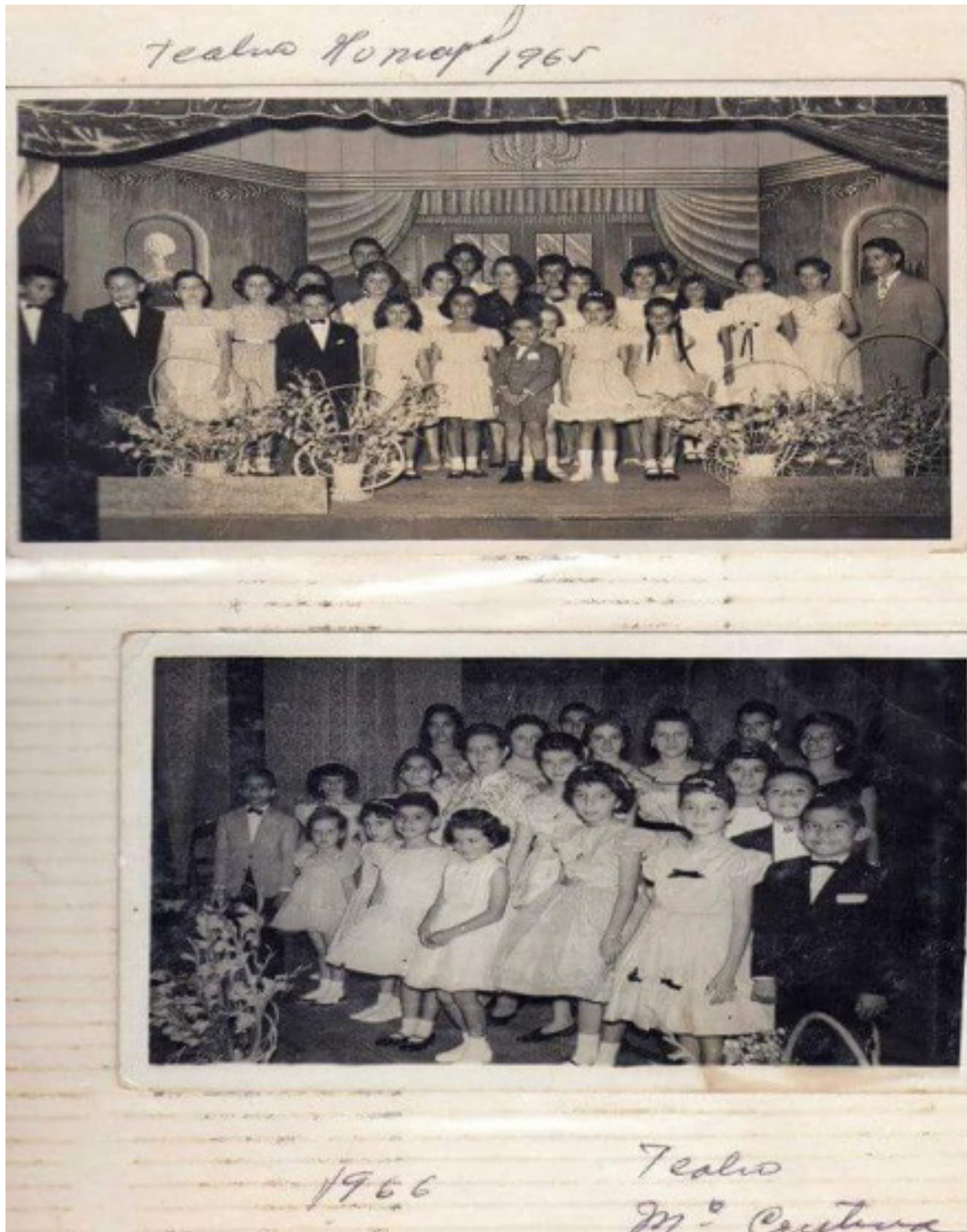
Figura 4. Ceremonia de Clausura de la academia de estudios musicales 1965 y 1966