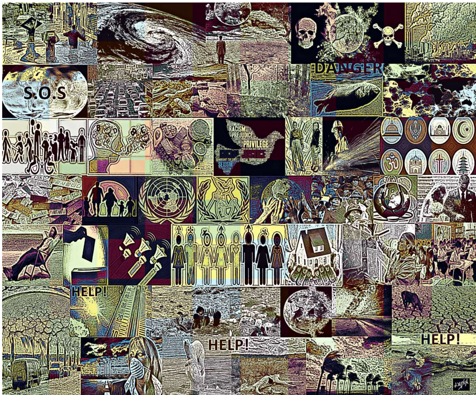
Awareness II. (2019). Digital art / Canvas, 100x100cm.

Obra seleccionada Human Rights #clima- l'edizione 2019, Fondazione Opera Campana dei Caduti di Rovereto, Trento, Italia.