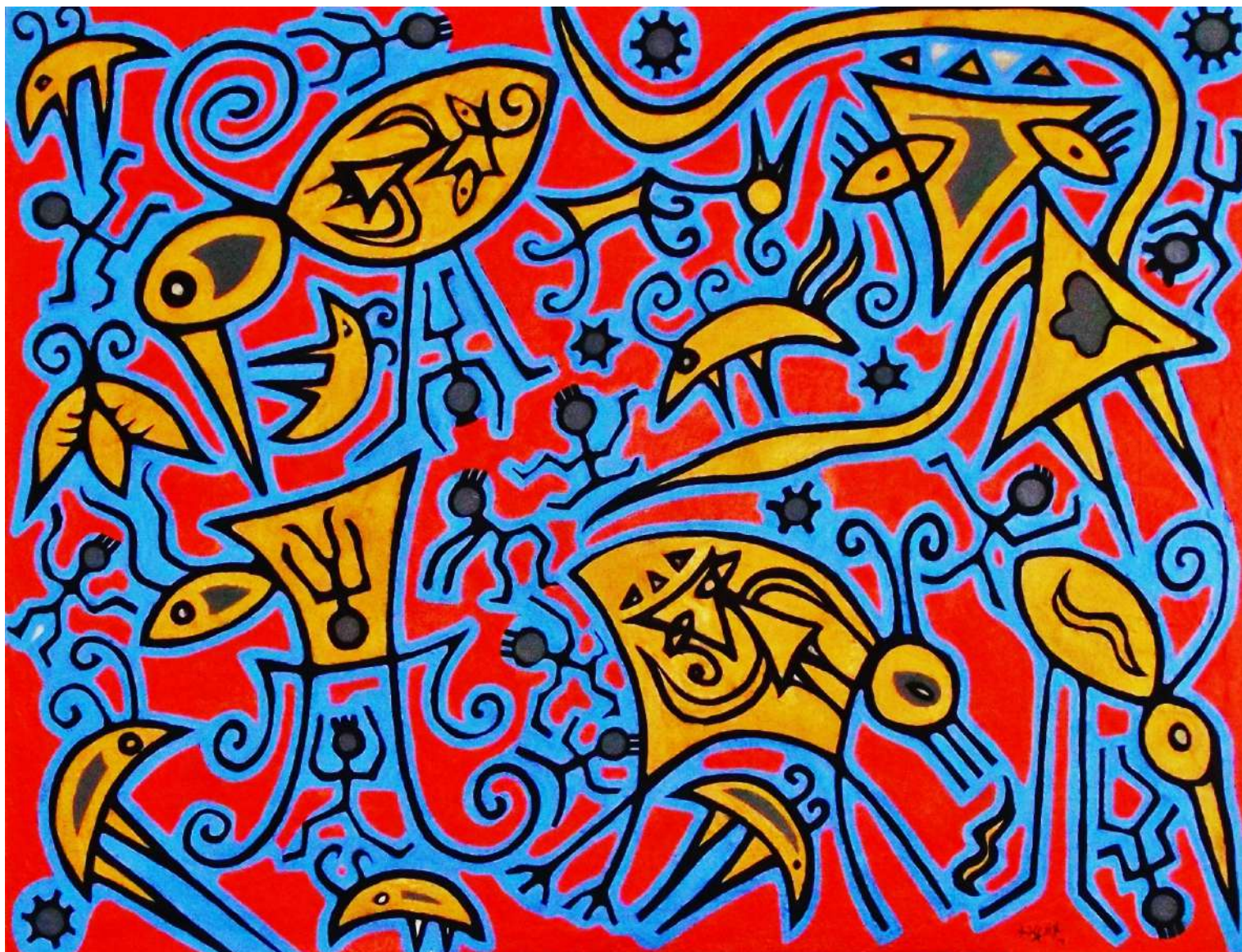
Wake up. (2014). Mixta / Canvas, 100x130cm.

Obra seleccionada en la 6th Beijing International Art Biennale Memory and Dream, National Art Museum of China.