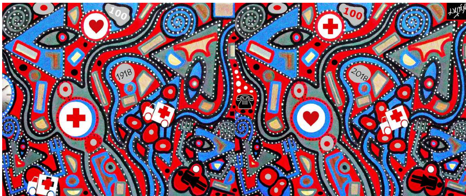
Informalismo II. (2018). Mixta / Tela, 100x200cm. Obra conmemorativa Aniversario Centenario Cruz Roja Mexicana.