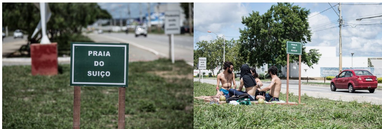
Figura 1. Praia do Suíço . Registro de performance/intervención urbana