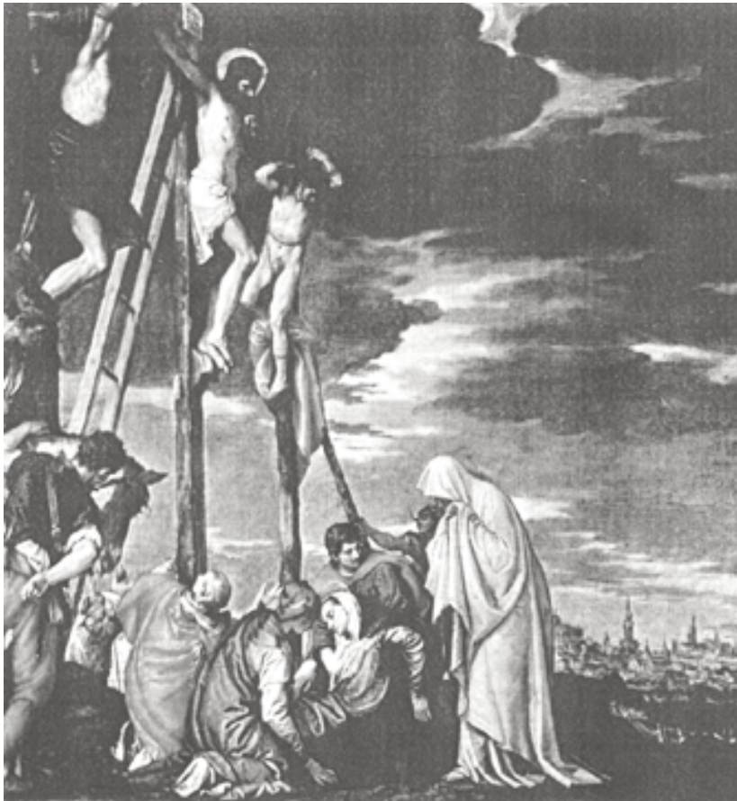
LA CRUCIFIXIÓN. El Veronés, hacia 1575, lienzo al óleo, 102 x 102 cm. Louvre. París.

las creencias cristianas que estaban siendo afectadas por el nuevo pensamiento humanista, que se manifestó sobre todo en la literatura. Se pretendía que por medio de la pintura se introdujeran las Sagradas Escrituras. Ante el racionalismo de la época se da un nuevo espíritu antirrenacentista, se anuncian nuevas fundaciones de Órdenes, como la Fundación de la Compañía de Jesús que se convertiría en modelo para la fe y disciplina eclesiástica. La creación artística fue puesta bajo la vigilancia de los teólogos.