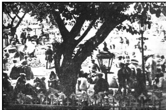
Fotografía Día de Mercado.

Fuente: BOLETÍN OFICIAL, 22 de marzo de 1875, p. 4.