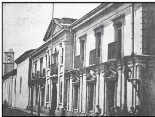
Fotografía Palacio Nacional.

El bien conocido fotógrafo Otton Siemon se dá la honra de avisar al público, de que actualmente está provisto de todos los elementos necesarios para ejecutar fotografías de toda clase, según las mas modernas invenciones y conforme á las reglas verdaderas del arte de que se ha ocupado desde largo tiempo en Europa. Con particular se permite llamar la atención del público, á la facilidad con que puede tomar vistas de edificios, haciendas y paisajes en toda parte de la República, y en diferente tamaño. Á las personas