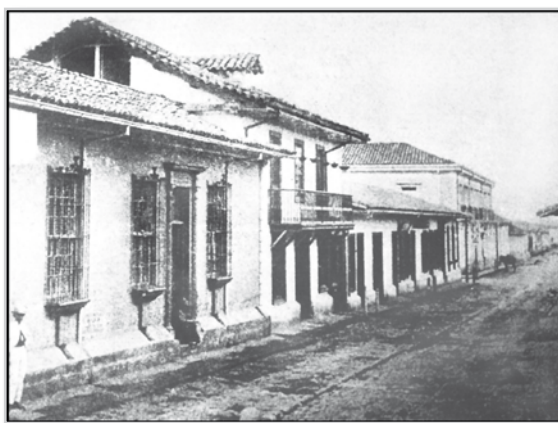
Fotografía Calle del Correo.