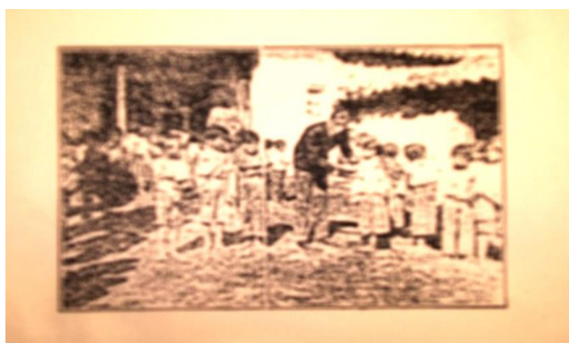
Escuela de Artes y Oficios, 1900

Sin embargo durante las presidencias de Caamaño y Cordero, se promueve su proyecto político nacional a través de discursos y ensayos. Sus enemigos políticos se dedicarán a promover las reformas liberales radicales en oposición a los proyectos de modernización de índole católica promovidos por el progresismo.