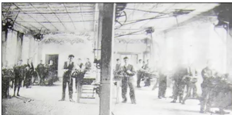
Fábrica La Victoria 1915 1

Discursivamente, se evidencia un intento de reconstruir las clases populares y a la etnicidad como elementos de la sociedad ecuatoriana. El discurso inclusivo de modernidad y progreso va de la mano con la intensidad del uso de la fotografía. Producción relevante a las nuevas fábricas y material destinado a las exposiciones internacionales. Inclusión de los sectores indígenas y las clases populares tienen que ver directamente con una visión positiva de la apertura liberal de la producción industrial.