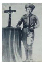
Imagen de Juan soldado 4

Expresándose una hibridación cultural por el proceso de reterritorialización de las culturas, en una devoción nueva dirigida a la figura de Juan Soldado. Esta hibridación cultural surge de la separación física de la gente de sus prácticas existentes (de la religiosidad popular de sus lugares de origen) para recombinarse en nuevas formas y prácticas, como en el caso de la devoción a Juan Soldado.