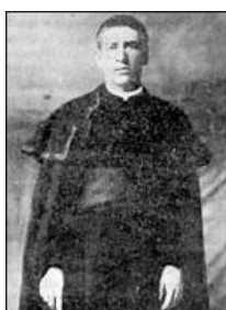
Santo Toribio Romo 14

“especialmente como se codifica en la religión ha sido siempre la base de la moralidad de la sociedad. Con una base mítica, una revelación de Dios o de los dioses la legitimidad de un sistema de ética era absoluta e incuestionada. No había dudas, ya que cuestionar la validez del código moral era cuestionar la validez del mito y la legitimidad de la sociedad en sí”. (Bierlein, 2001, p. 40)