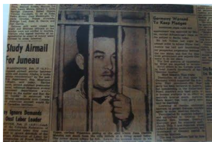
Fig. 4. Detenido en la cárcel municipal de Tijuana 9

En Europa hubo la creencia en el rito del sacrificio en la ejecución de criminales, quienes hacían posible tener suerte con poseer tan solo un poco de sangre o restos humanos del sacrificado; sangre derramada del ánima que está cerca de los santos y del todopoderoso y que pide vida eterna; de manera que si ayudas a las ánimas estas te ayudarán a ti. Aquí, podemos ver que la tradición europea de la edad media se mantiene viva en nuestros países con herencia cultural occidental en los contornos de la religiosidad popular, ya que “Desde el comienzo del cristianismo el pueblo ha canonizado a sus propios santos. La iglesia católica oficial afirma ser la única responsable del procedimiento, pero las canonizaciones populares siguen siendo muy frecuentes, incluso si se trata de delincuentes confesos “. (Vandderwood, 2008, p.14)