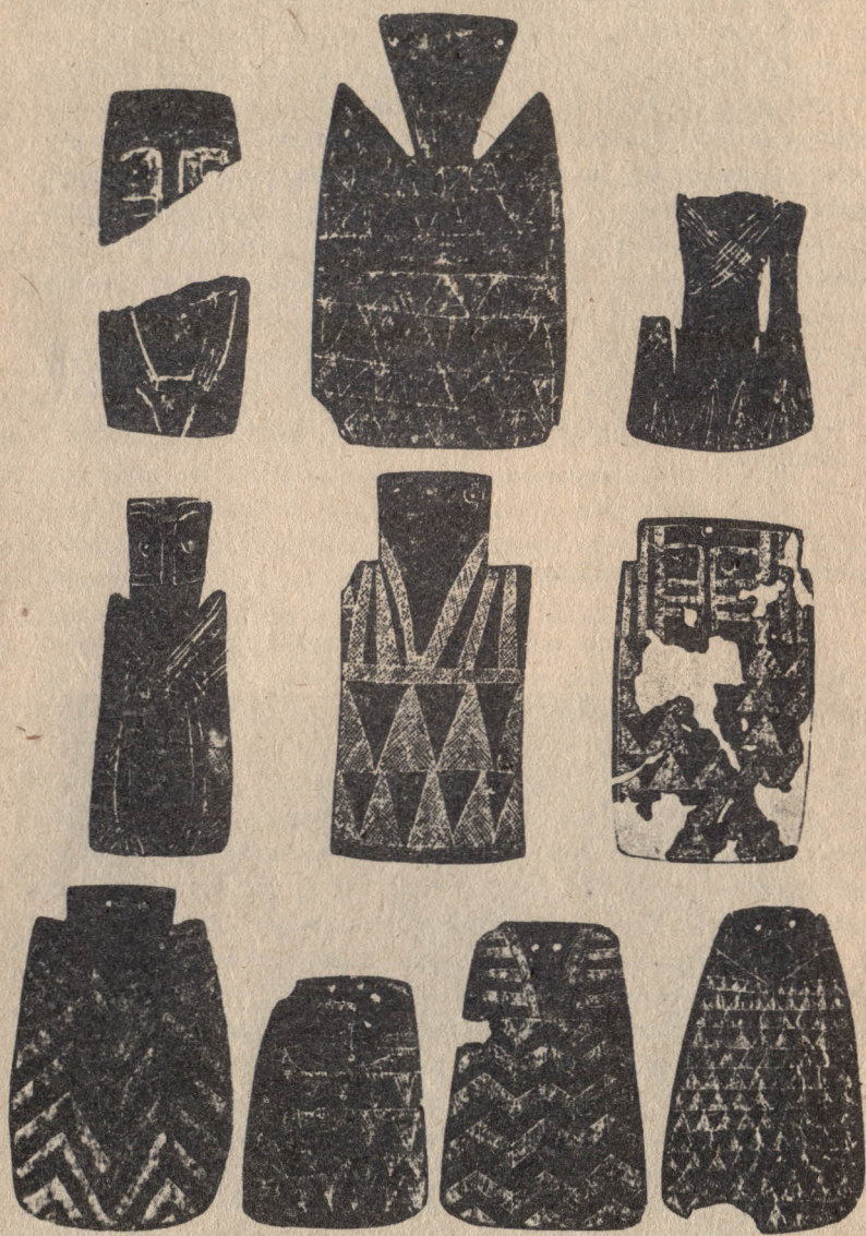
Idolos en placas de pizarra procedentes de Extremadura y Portugal.