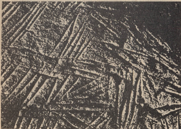
Grabado en piedra, Laugerie Haute (Dordogne).

Obvio es decir que el empleo del bronce fue precedido de la metalurgia del cobre y la del oro, metales no debidos a aleación, mucho más blandos, que se prestaban al batido y al repujado, o labrado con punzones. Los metales, por su brillo y su belleza fueron destinados muy pronto a la producción de objetos de adorno personal; por su tenacidad y dureza se aplicaron también temprana y principalmente a la armería. Los collares y cinturones de bronce, tratados con motivos en altorrelieve, de pequeños conos o líneas unidas en esquema curvilíneo también poseen elevado carácter. Brazaletes, broches, placas de cinturón, diademas y pectorales son otros elementos propios de la época con casi exclusiva decoración abstracta.