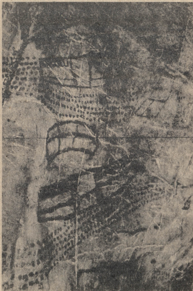
Pintura de El Castillo (Santander).