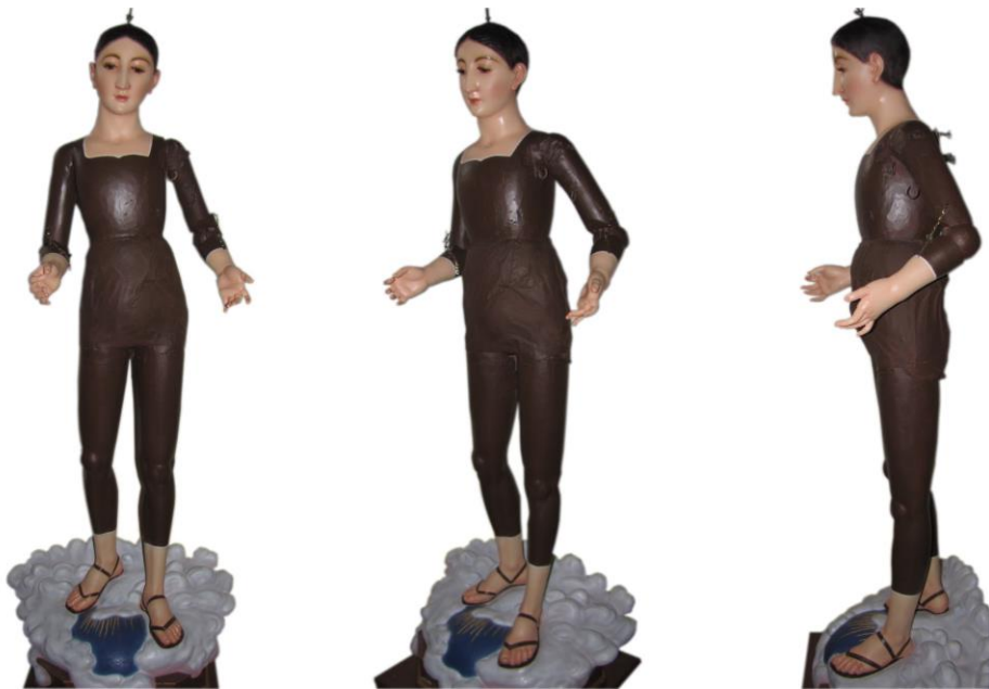
Imagen 16. Imagen de vestir de Nuestra Señora del Carmen, El Carmen de Heredia