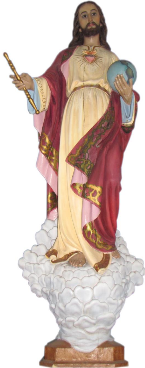
Imagen 11. Corazón de Jesús (Cristo Rey), iglesia antigua de la parroquia Corazón de Jesús, Heredia