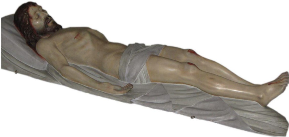
Imagen 1. Cristo yacente de la parroquia Inmaculada Concepción, Heredia

en el catálogo levantado por Alejo Fumero Páez aparecen 139 obras 2 , de las cuales sólo 28 tienen temática religiosa cristiana asociada a los temas de la imaginería católica y las únicas obras en manos de la Iglesia Católica costarricense que aparecen en dicho catálogo son: el Cristo yacente y los ángeles del santo sepulcro de la parroquia de la Inmaculada Concepción de Heredia y el Cristo Resucitado de la iglesia del Corazón de Jesús de Heredia.