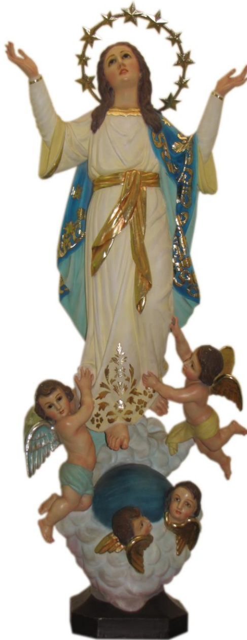
Imagen 10. Asunción de María, iglesia de la Inmaculada Concepción de Heredia