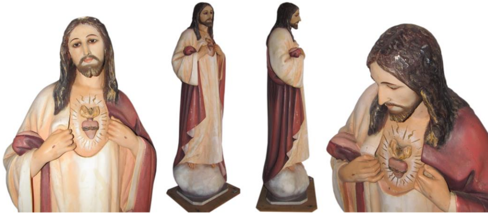
Imagen 13. Sagrado Corazón de Jesús de la iglesia de Concepción de San Rafael de Heredia