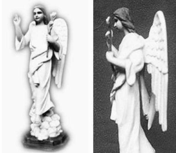
Imagen 7. San Gabriel Arcángel, colección particular