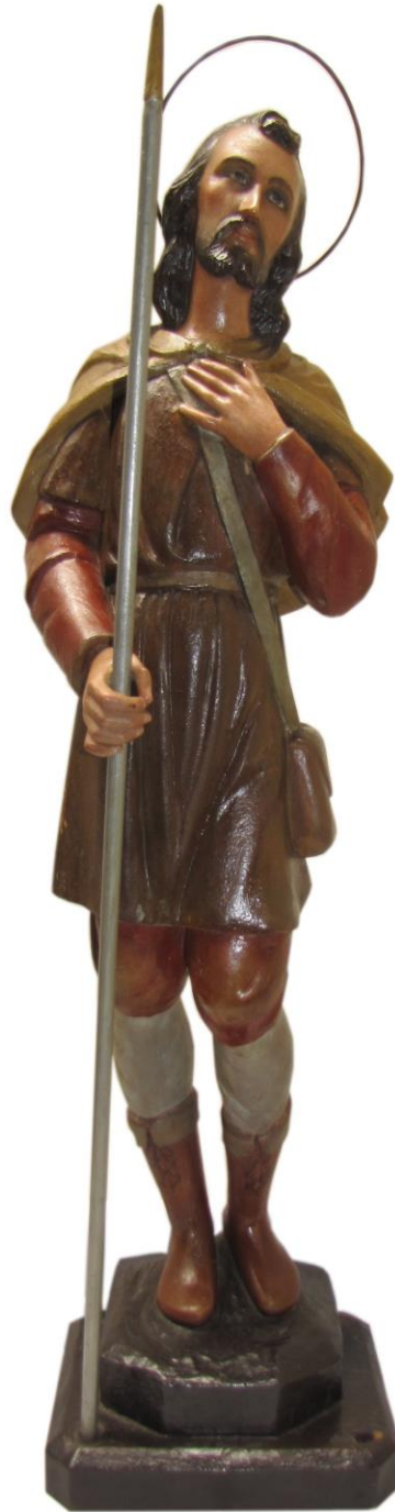
Imagen 12. San Isidro Labrador de la iglesia de Barreal de Heredia