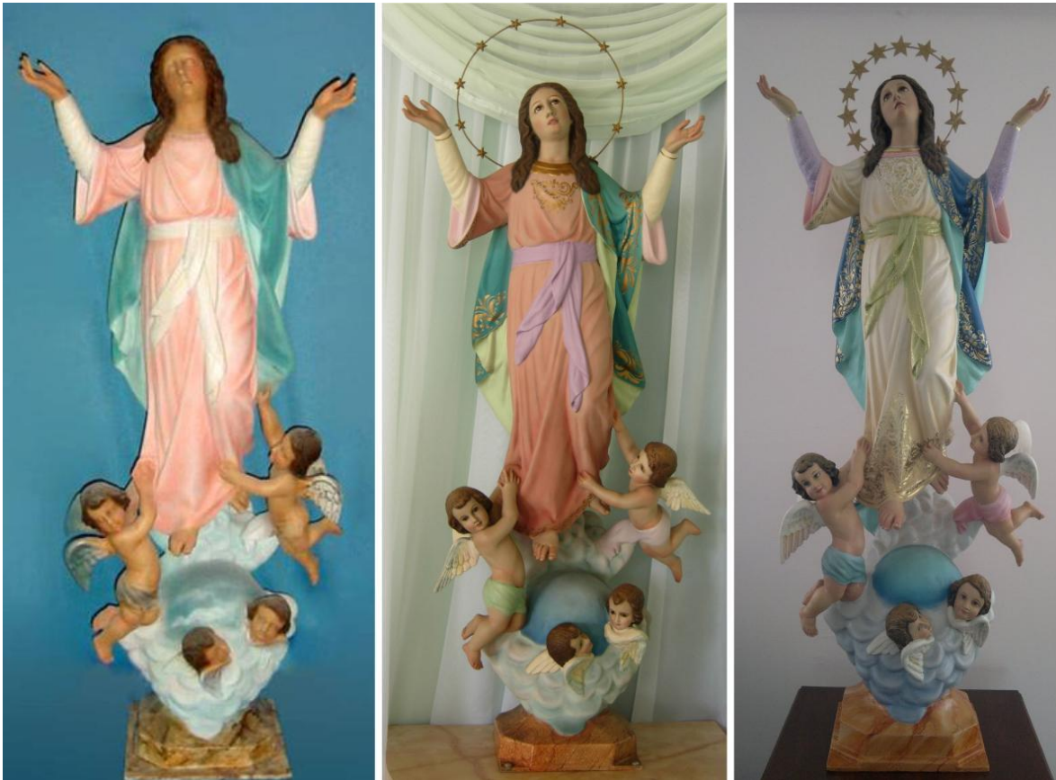
Imagen 17. Copias de la imagen de la Asunción de María realizadas por el imaginero Orlando Carranza (q.D.g.), ubicadas en la iglesia de Cinco Esquinas de Aserrí y en el Seminario Nacional Nuestra Señora de los Ángeles