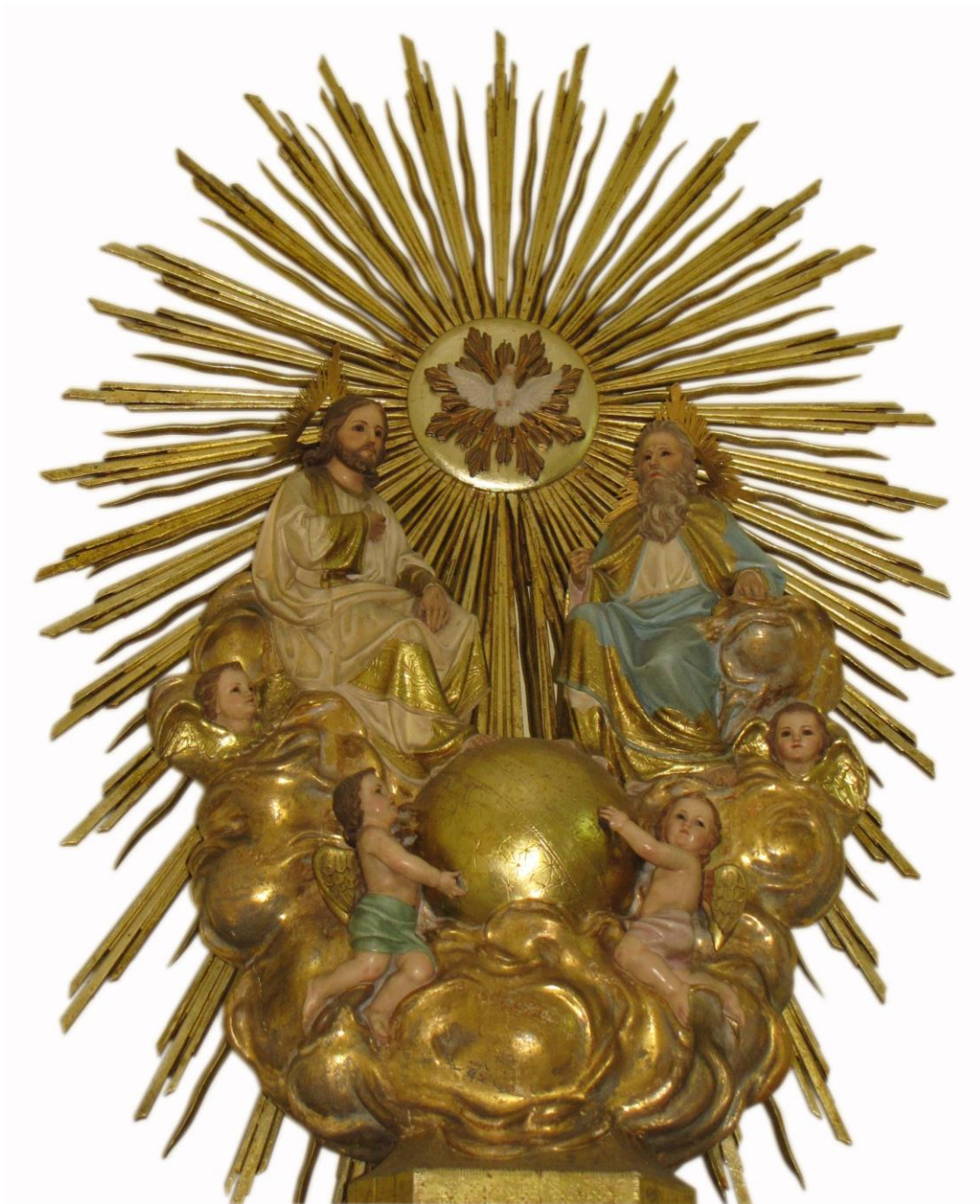
Imagen 4. Santísima Trinidad del taller de Domingo Peris, Barcelona (fecha de 1929), ejemplo de la imaginería catalana importada a Costa Rica, ubicada en la iglesia de San Miguel de Escazú