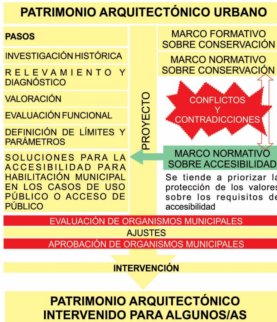
Gráfico 1. Síntesis de proceso actual para una intervención patrimonial