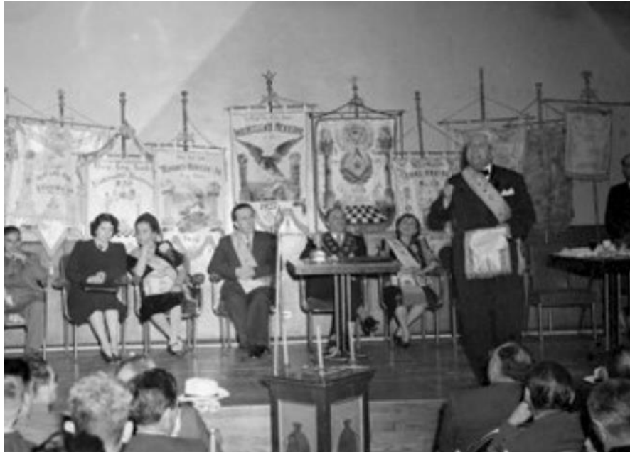
Imagen 1. Miembros de logias durante un evento.