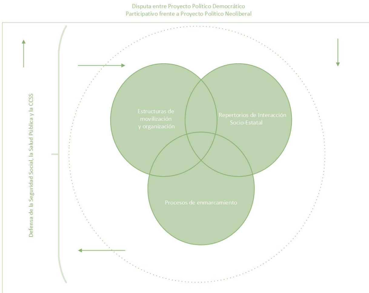
Figura 1. Diseño de la propuesta teórica