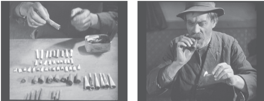
Figura 3. M, Una ciudad busca un asesino. Dir: Fritz Lang. 87 minutos, B/N, Universum Film.

También podemos considerar como trapero el mendigo que, en una escena de M, Una ciudad busca un asesino ( M, Eine Stadt sucht ein Mörder ) (1931), de Fritz Lang, abre una caja de hojalata y ordena sobre una mesa diversos tipos de cigarrillos y puros que, previsiblemente, se ha preparado el mismo. Al final elige un puro y lo fuma.