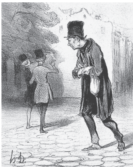
Figura 1. Honoré de Daumier, 1842. “El recogedor de colillas de cigarros” Placa 4. Serie: Bohemios de París.

Podemos identificar al recolector de colillas de cigarrillo en tres prácticas visuales: la caricatura, la fotografía y el cine. Iniciamos las representaciones visuales con Honoré Daumier y su litografía El recogedor de colillas de cigarrillo , publicada en el periódico Le Charivari , el 5 de diciembre de 1841, placa número 4 perteneciente a la serie Bohemios de París [ Bohémiens