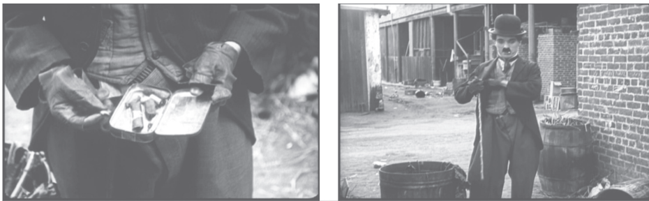
Figura 4. El chico. Dir: Charles Chaplin. 68 minutos, B/N, Triad Productions.

Son diversas las apariciones del recolector de colillas de cigarrillo en las películas de Charles Chaplin. Charlot es un trapero y, como tal, está acostumbrado a recolectar colillas. En El chico ( The Kid ) (1921), en la escena inicial, la primera acción que realiza Charlot, una vez que se acerca a la cámara, es sacar un cigarrillo de una caja de hojalata y encender un cerillo. Después de varios intentos, lo prende y se lo fuma. De nuevo inferimos que se ha fabricado tabaco a partir de la recogida de colillas y del papel para fumar que tiene guardado.