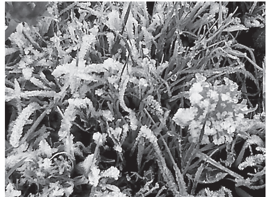
Fig. 5: Vegetación cubierta por hielo debido a las bajas temperaturas.

Uno de sus atractivos es la posibilidad de transitar por dos sectores diferentes, permitiendo al visitante disfrutar de dos tipos de ambiente: