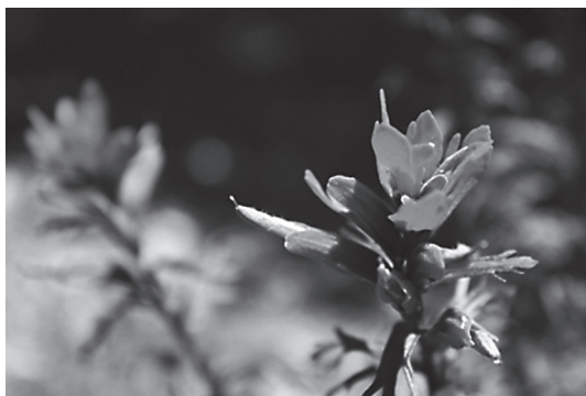
Fig. 2: Flor de la Castilleja irazuensis.

( Turdus nigrescens ), tångara de monte cejiblanca ( Chlorospingus pileatus ) y junco vulcanero ( Junco volcanis ).