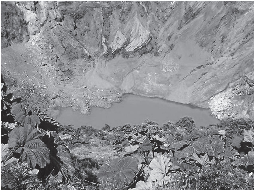
Fig. 1: Cráter Principal del Volcán Irazú.

las especies de plantas más representativas se encuentran la castilleja ( Castilleja irazuensis ) que es endémica del Irazú (Fig. 2) (Morales & Bermúdez, 2002), aunque a través de los años se ha trasladado también hacia el Parque Nacional Volcán Turrialba. También se cuenta con la sombrilla de pobre ( Gunnera insignis ) llamativa por sus hojas grandes, rugosas y de forma muy similar a una sombrilla, de ahí su nombre.