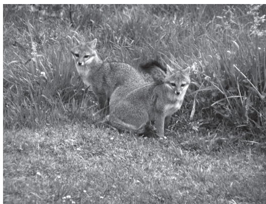
Fig. 3: Zorras grises ( Urocyon cinereoargenteus ) Sector Prusia.

En el Sector Prusia, la vegetación natural fue destruida por las erupciones de 1963-65. Para tratar de proteger los suelos y evitar nuevas avalanchas sobre la ciudad de Cartago, se realizó un proyecto de reforestación intensiva utilizando tanto especies exóticas como nativas. Las especies introducidas fueron: ciprés, pino y eucalipto; mientras que las especies nativas utilizadas fueron: roble ( Quercus sp.), jaúl ( Alnus sp.) y salvia ( Buddleja sp.) (Morales & Bermúdez, 2002). En este sector es posible caminar por hermosos senderos, llenos de exuberante vegetación. Una de sus bellezas más sobresaliente es la posibilidad de observar hongos de diversas especies, uno de los más llamativos por su colorido es el hongo Amanita muscaria (Fig. 4).