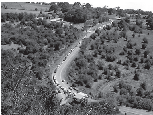
Fig. 6: Vista de la entrada al Parque Nacional Volcán Irazú y su gran afluencia de vehículos.

Prusia y Cráteres. Presenta la peculiaridad de tener acceso a los principales cráteres en cualquier tipo de vehículo, siendo esta característica poco común globalmente.