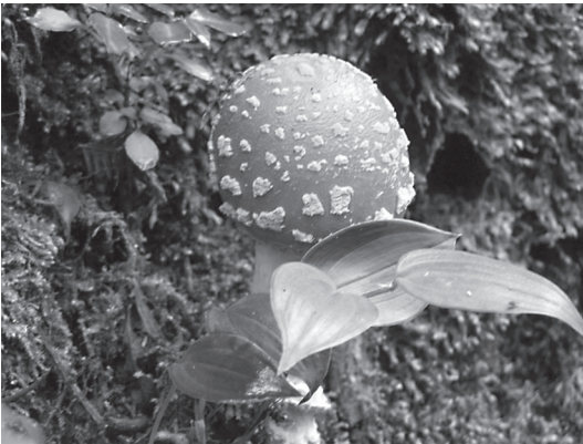
Fig. 4: Hongo tipo Amanita muscaria , Sector Prusia (Fotografía: Horacio Herrera S.).