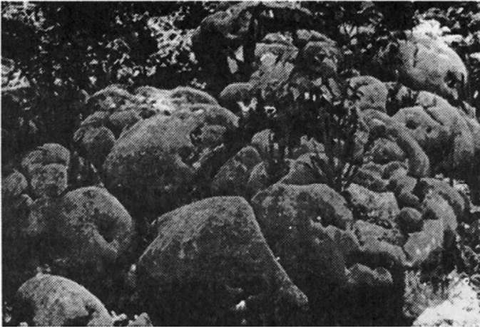
Fig. 4: Plántulas de Cyperus sp., Ludwigia sp., Eleocharis sp. junto con los helechos Elaphoglossum sp. y Acrosticum sp. creciendo entre colonias de Siderastrea siderea y Porites astreoides , Portete (10.V.92).