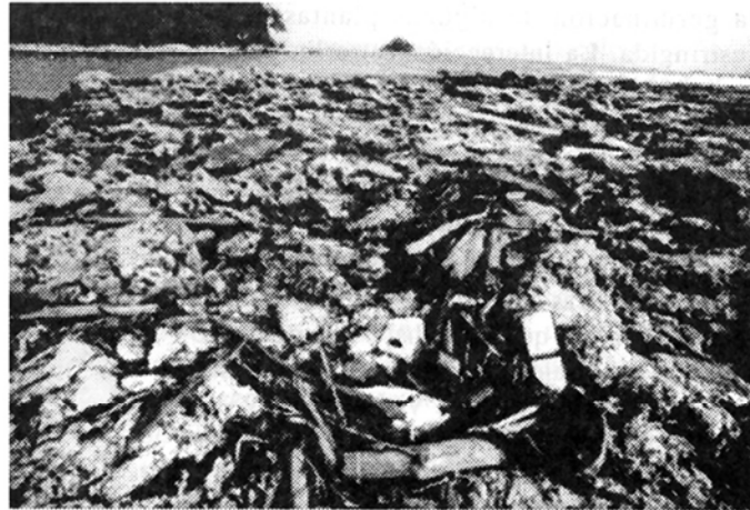
Fig. 10: Fragmentación y volteo de colonias de Agaricia sp., Acropora palmata , Millepora complanata , Porites porites , Porites astreoides , Diploria strigosa y Siderastrea siderea ocasionada por troncos, ramas y materia vegetal, Portete (13.X.91).