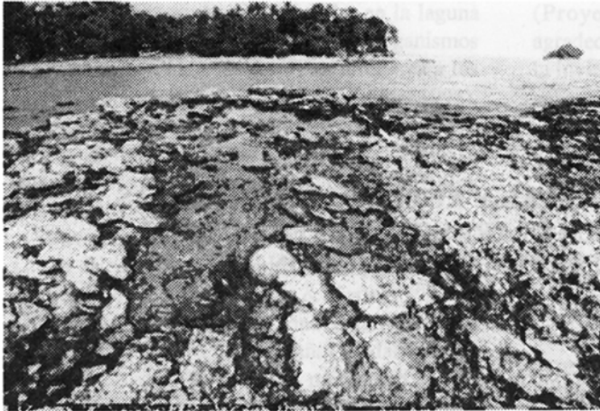
Fig. 1: Canales con agua colonizados por algas verdes entre las colonias de Siderastrea siderea , Portete (13.V.91). En la ribera opuesta, plataforma del sector Moín-Portete; Isla Pájaros en el fondo.