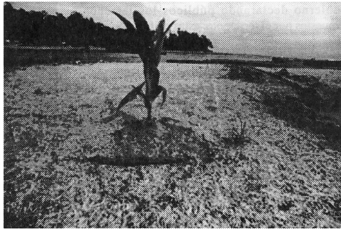
Fig. 13: Transplantes de palmas en un lecho de Thalassia testudinum , Portete (15.VII.91).