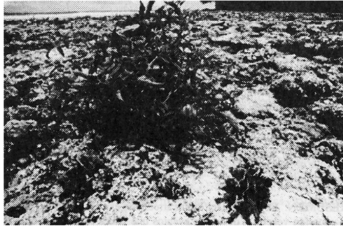
Fig. 2: Planta de tomate ( Lycopersicum sp.) con frutos creciendo en un parche de algas calcáreas ( Halimeda sp.); alrededor de la planta se encuentran los corales Agaricia sp., Porites astreoides , Siderastrea siderea , Favia fragum y el hidrocoral Millepora complanata , Portete (14.VII.91).