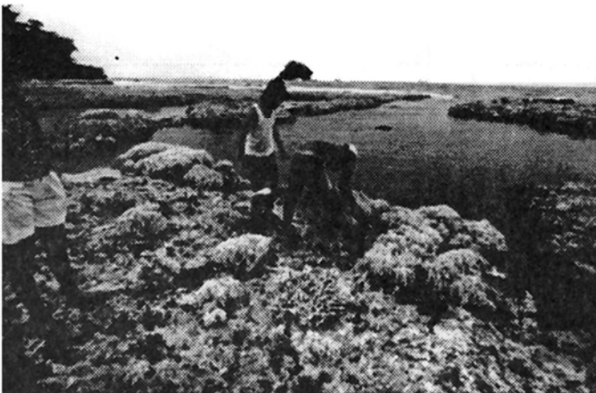
Fig. 11: Destrucción y extracción de colonias ( Millepora complanata , Agaricia sp.) durante la búsqueda de objetos de valor en las plataformas, Moín-Portete (3.V.91).