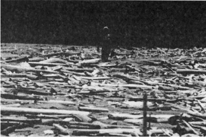
Fig. 9: Restos de troncos, ramas y materia vegetal llevadas por las corrientes a las playas, arrecifes y plataformas expuestas, Cocles (11.X.91).