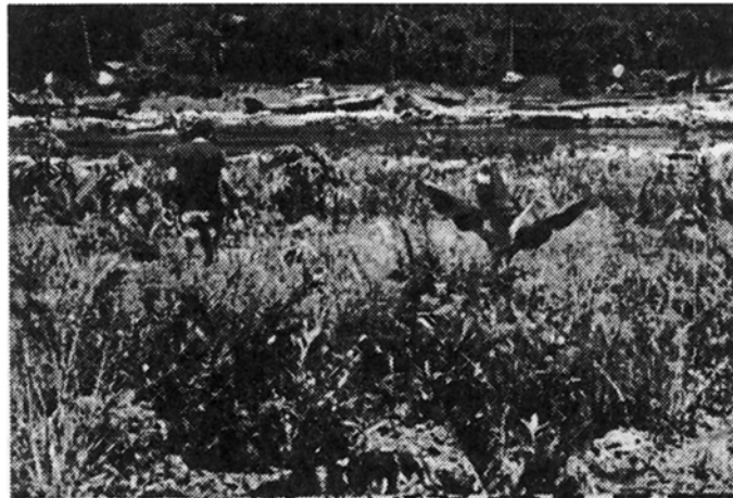
Fig. 5: Parches de vegetación mixta donde aparecen Cecropia sp., Musa sp., Luehea sp. y varios grupos de hierbas y helechos, Portete (10.V.92).