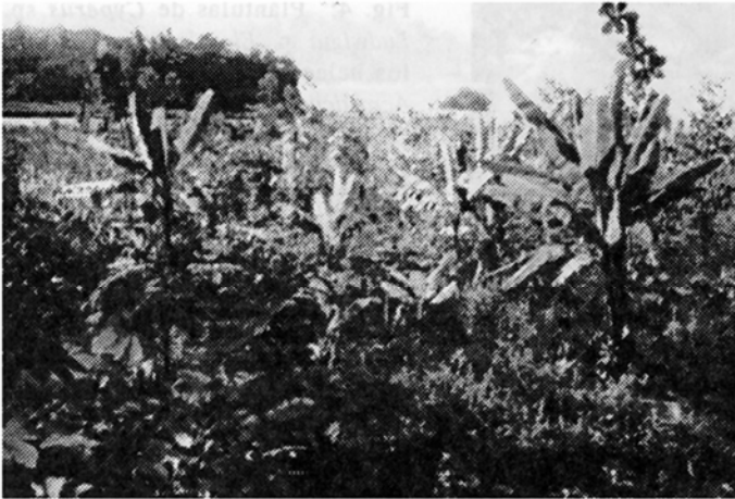
Fig. 7: Vegetación mixta donde dominan las plantas leñosas 31 meses después del terremoto, Portete (1.XI.93). Aproximadamente la misma perspectiva de la Figura 1.

guardaparques y a corta distancia de un bosque de moderado desarrollo. Otras áreas monitoreadas fueron el sector de Moín y los alrededores de Punta Piuta. No se realizaron estimaciones cuantitativas de la sucesión vegetal, únicamente se fotografiaron algunos lugares consecutivamente durante varios meses, anotando el grupo de plantas presentes en el sitio.