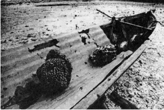
Fig. 12: Utilización de colonias ( Diploria clivosa y Millepora complanata ) como anclas y lastre, Portete (15.VIII.91).