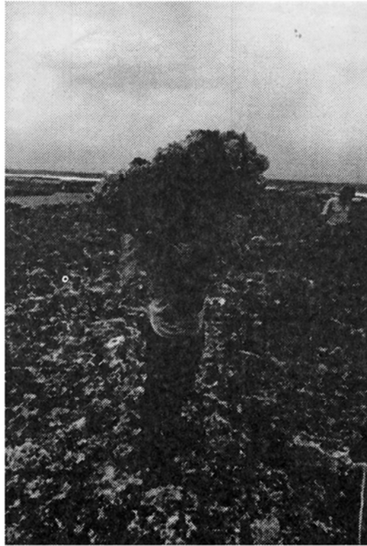
Fig. 16: Extracción de colonias ( Millepora complanata y Agaricia sp.) para la venta y confección de artesanías, Moín-Portete (3.V.91).

Finalmente, se observó durante algún tiempo en las plataformas de Moín y Portete, la extracción de corales ramificados y foliosos y de hidrocorales para la confección de recuerdos y adornos (Figs. 11 y 16). Esta actividad aunque de mucho menor impacto que las anteriores, modificó considerablemente la posición vital de las colonias en los arrecifes. Adicionalmente, el tránsito sobre las plataformas de personas involucradas en cualquiera