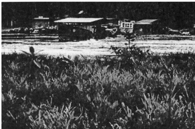
Fig. 6: Secciones de la plataforma dominadas por los helechos Elaphoglossum sp. y Acrosticum sp.; sobresalen las especies leñosas Terminalia catapa y Sapium sp., Portete (3.IX.92).