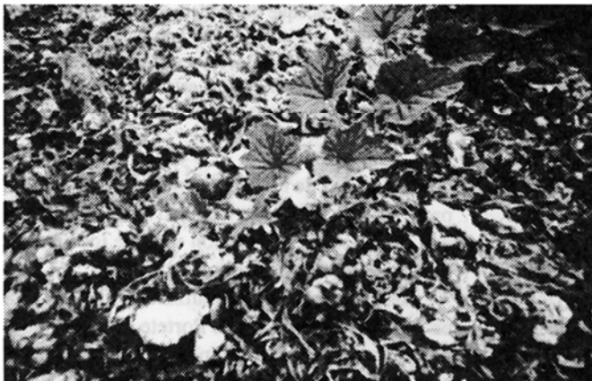
Fig. 3: Cyclanthera sp. invadiendo un lecho de Thalassia testudinum ; se pueden observar colonias pequeñas de Porites porites y esqueletos del erizo Echinometra lucunter , Portete, (14.VIII.91).