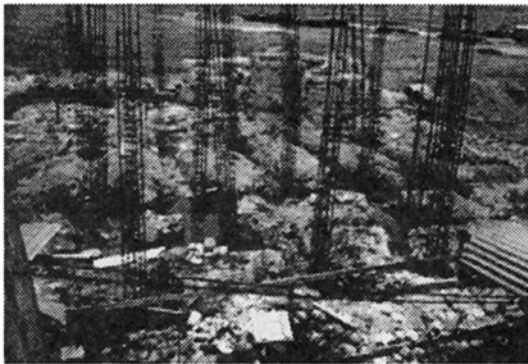
Fig. 15: Construcción sobre las plataformas del sector Punta Piuta-Limón (1.XI.93).