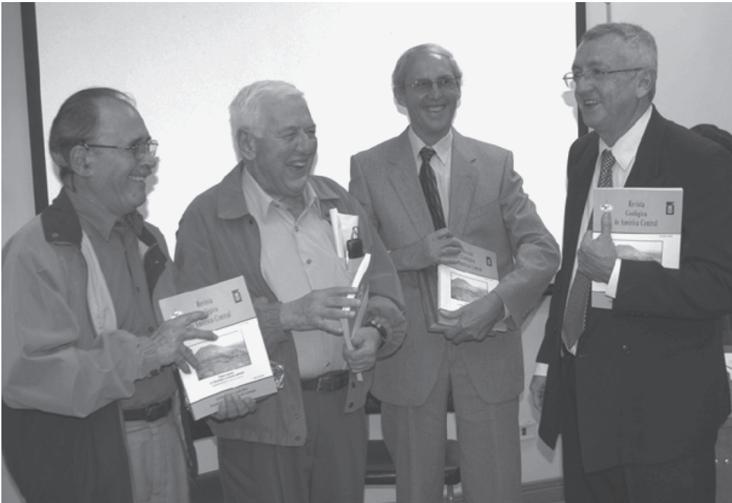
Fig. 1: El primer volumen especial de vulcanología fue dedicado en el 2004 a los geólogos Rodolfo Madrigal, Gregorio Escalante, Siegfried Kussmaul y Sergio Paniagua, por sus cualidades profesionales y académicas, así como por sus contribuciones pioneras en el campo de la vulcanología (tomado de: Soto & Alvarado, 2006).