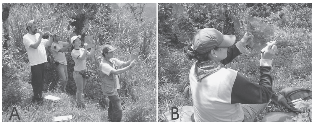
Fig. 1: Estudiantes del curso “Deslizamientos y otras formas erosivas” calcando el paisaje. A) Estudiantes realizando el calco del paisaje. B) Detalle del trabajo de calco

sujeta un pliego de acetato igualmente transparente. El trazo se debe realizar con un marcador del más delgado que se encuentre en el mercado y que sea inborrable.