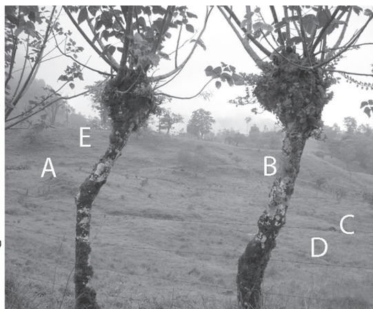
Fig. 2: Croquis elaborado mediante el calco y paisaje calcado sujeto a un proceso de deslizamiento (San Antonio de Pascua, Siquirres). Con letras se asocian los elementos del paisaje que los estudiantes pudieron identificar claramente